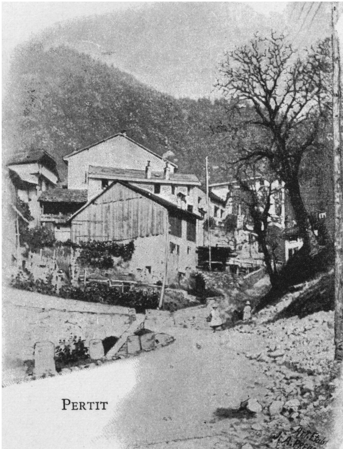
Fig. 2. Les ponts sur le chemin des Vuarennens entre 1889 et 1897. Au premier plan le chalet à Dubochet. Derrière les arbres: le four banal, reconstruit après la catastrophe de Sonzier en 1888. Photo tirée de: Émile Yung, Montreux et ses environs , Zurich: Établissement J. A. Preuss, 1898, p. 46.