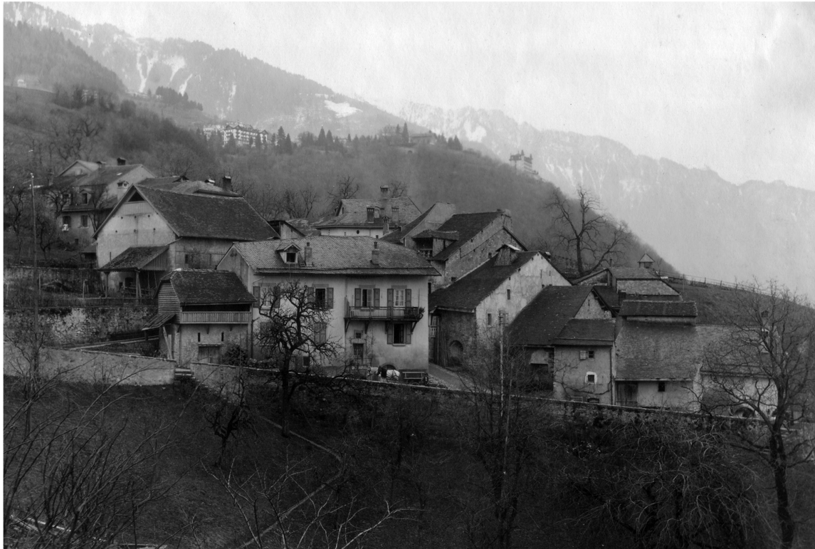
Fig. 3. Le hameau vers 1900.

encore beaucoup de jeunes arbres aux alentours du village. Rambert évoque ensuite la maison dite « des Vignes » où il a passé de nombreuses journées: « Au milieu de ce groupe de maisons il en est une qui n'est ni la plus riche ni la plus pauvre et rien ne la distingue des autres, mais on l'aurait bien reconnue il y a vingt ou trente ans grâce à un rosier blanc qui montait en espalier contre le mur noirci. » 14