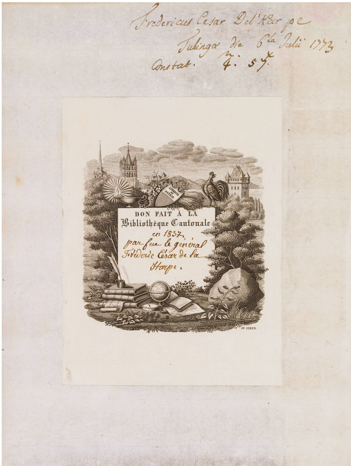
Fig. 3. Deuxième page de couverture: signature de «Federicus Cesar Del'Harpe», lieu «Tubingæ», date «6 juillet 1773» et coût d'achat 4 livres 57 kreuzers». Ex-libris de «F. C. De La Harpe».