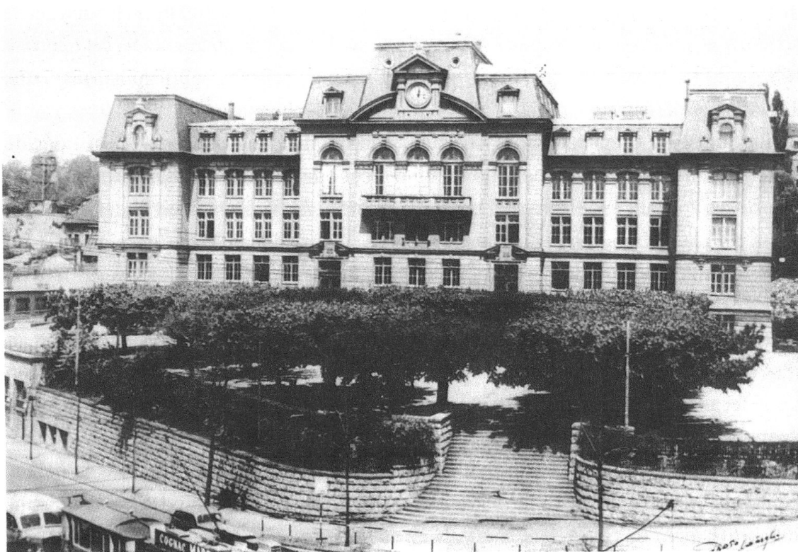
1. Le bâtiment de l'École normale vers 1940. ACV, K XIII 377/230/605, photographie de l'auteur.

Ce problème crucial désarçonne le Département de l'instruction publique; par le biais de mesures exceptionnelles et prises dans l'urgence, il doit alors fréquemment faire face à une situation qu'il peine à maîtriser. Au niveau de la formation des instituteurs et des institutrices, l'École normale de Lausanne (ÉNL) se voit contrainte d'adapter sa structure à la nouvelle situation avec grande difficulté. Le département décide alors de créer en 1953 une classe spéciale de formation rapide au sein de l'ÉNL, d'une durée d'un an, destinée aux porteurs d'un baccalauréat, d'un certificat de maturité ou d'un diplôme de culture générale. Dès 1967, cette filière se nomme «classes de formation pédagogique». En 1965, est créée l'ÉN d'Yverdon qui fait partie du Centre d'enseignement supérieur du Nord vaudois (CESSNOV); ce centre regroupe ainsi dès 1975 un gymnase, l'ancienne ÉN et une division commerciale. Deux ans plus tard, les classes de formation pédagogique sont dirigées désormais par le directeur-adjoint du Séminaire pédagogique de l'enseignement secondaire (SPES) fondé en 1959, accentuant le rapprochement entre les deux institutions, alors que peu après il est décidé aussi de former des enseignant·e·s primaires à Montreux.