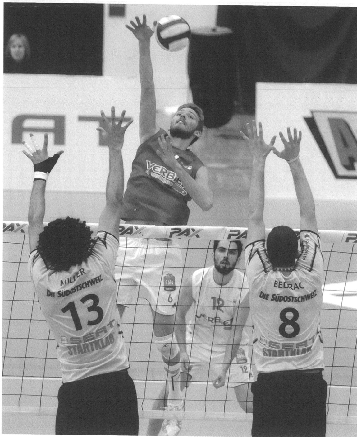
1 Le LUC Volleyball, un des fleurons du sport universitaire lausannois.