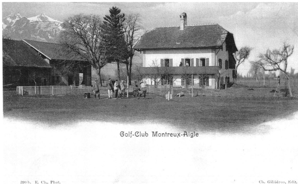
3 Le Club House en 1901, carte postale éditée par Ch. Gilliéron (éd.), coll. Jacques Menétrey.