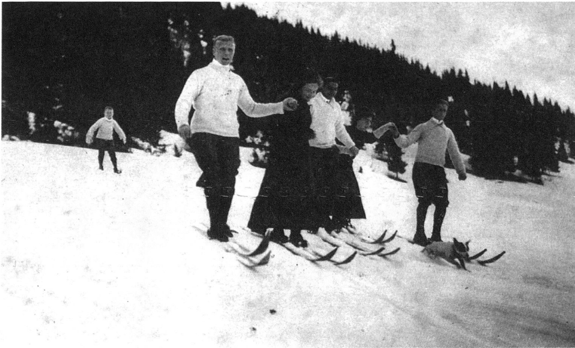
1 Leysin-Sport – Descente en skis, carte postale, coll. Gilbert Bollea.

Dans ce processus, les sports de loisirs jouent un rôle important, car la mise en place d'infrastructures ne saurait suffire. Il faut en effet convaincre les hôtes potentiels de la qualité de l'offre en mettant sur pied une propagande efficace. Aux affiches et aux cartes postales, qui sont alors deux supports privilégiés 7 , viennent s'ajouter les comptes rendus d'activités récréatives (gymkhanas sur glace ou neige par exemple 8 ) et sportives dans les journaux locaux et les revues sportives ou touristiques. Ces articles de presse offrent ainsi un reflet du dynamisme de la station. On s'efforce donc d'organiser des démonstrations par des champions (patineurs ou skieurs par exemple), des jeux, des courses, des matchs et des tournois auxquels les villégiateurs et les touristes sont invités à assister voire participer 9 . Des « coupes » remises en jeu annuellement traduisent la volonté des organisateurs de fidéliser participants et public. À Saint-Moritz, l'intérêt pour le ski aurait été éveillé, en 1902, par des Norvégiens, ce qui a conduit le Kurverein à faire venir un de leurs compatriotes afin de populariser ce sport 10 . En Suisse occidentale,