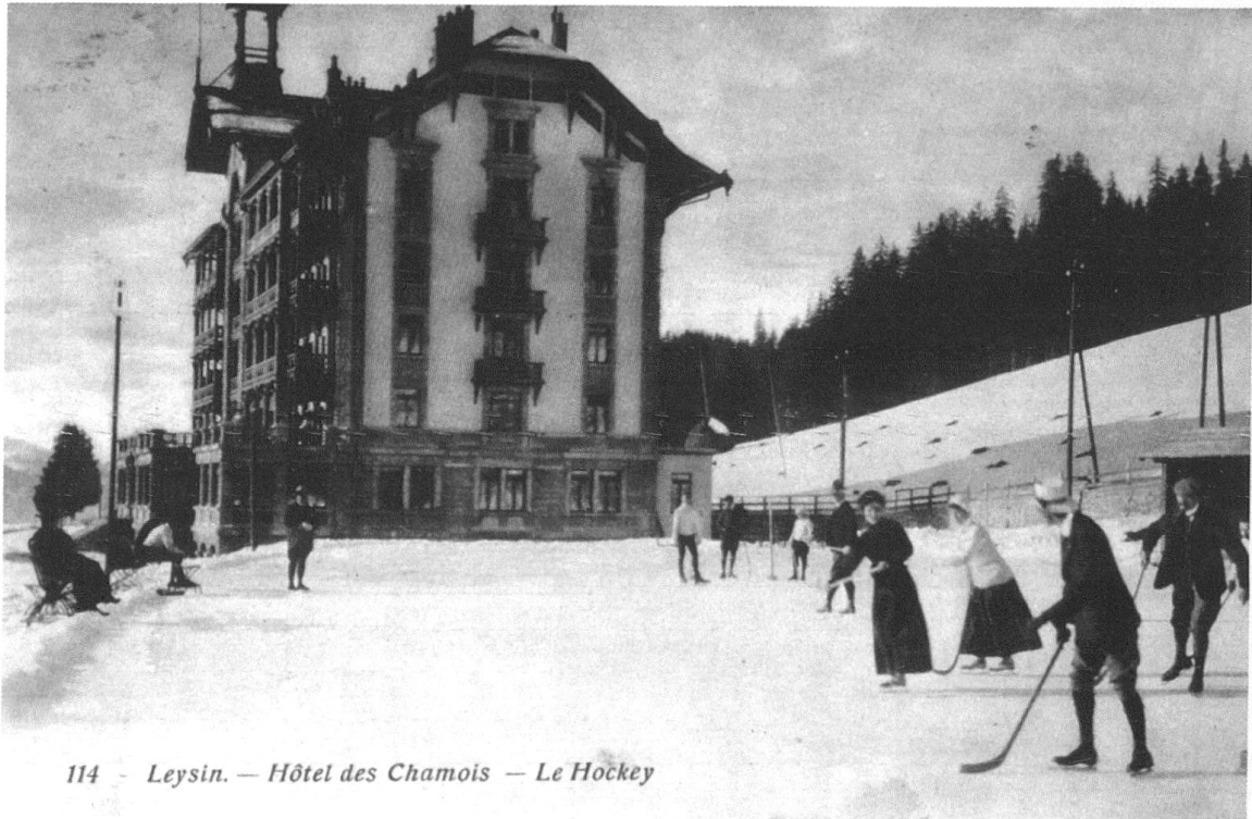
114 - Leysin. — Hôtel des Chamois — Le Hockey

4 Leysin — Hôtel des Chamois - Le Hockey, carte postale.