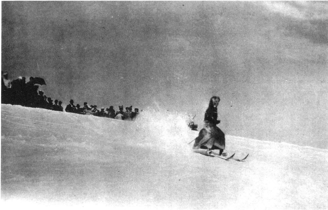
5 Leysin-Sport – Course en skis, carte postale, coll. Gilbert Bollea.

» Chacun pourrait voir et comprendre qu'à Leysin les précautions les plus grandes sont prises en vue de la prophylaxie de la tuberculose, il y a moins de danger pour une personne bien portante, même dans un Sanatorium, que dans un hôtel ordinaire à la plaine ou à la ville dont les chambres sont très fréquemment habitées par des tuberculeux et jamais désinfectées. » 47