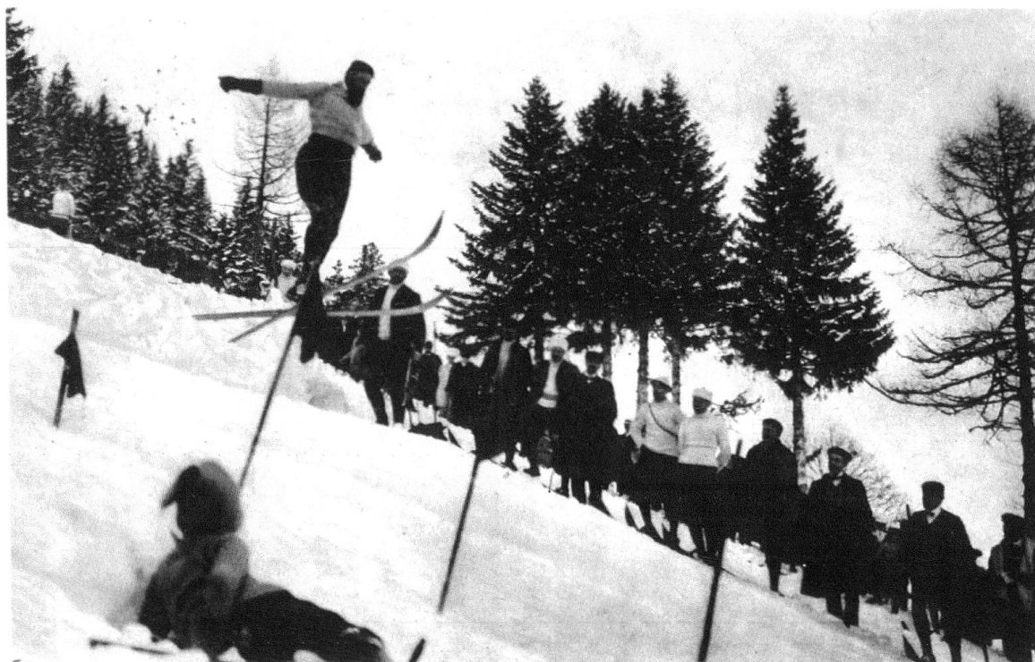
3 Leysin-Sport – Saut en skis, carte postale