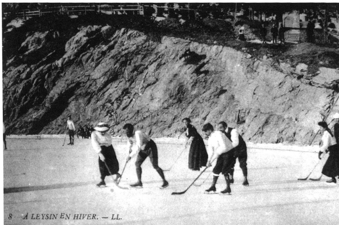
6 À Leysin en hiver, carte postale, coll. Gilbert Bollea.

de contagion. Comme on l'a vu, les régions et localités concurrentes se sont empressées d'utiliser cet argument à leur profit.