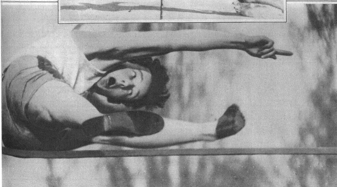
Saut en hauteur : tandis que les yeux mesurent encore l'obstacle, la bouche s'ouvre comme si ce mouvement pouvait alléger le corps tout entier.

tive : l'expression du visage au moment de l'effort suprême. — Tension, douleur, énergie, triomphe, désespoir, épuisement, toute la gamme des sentiments physiques et moraux joue, dans ces brefs instants, sur les traits du sportif. Qu'on en juge plutôt par ces quelques saisissants instantanés !