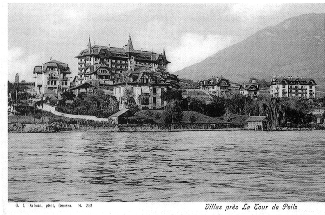
2 Quartier Bellaria : vue d'ensemble des villas et des grands bâtiments Wood, depuis le lac. Au premier plan, villa Les Biolles; au second plan : à gauche, villa Emilia et son chalet. Carte postale, vers 1905. Archives privées.

aux Archives de la Construction Moderne [ACM] à Lausanne 72 , et de publications : la villa a en effet subi des transformations telles au cours du xx e siècle qu'il ne reste que peu d'éléments du bâtiment d'origine.