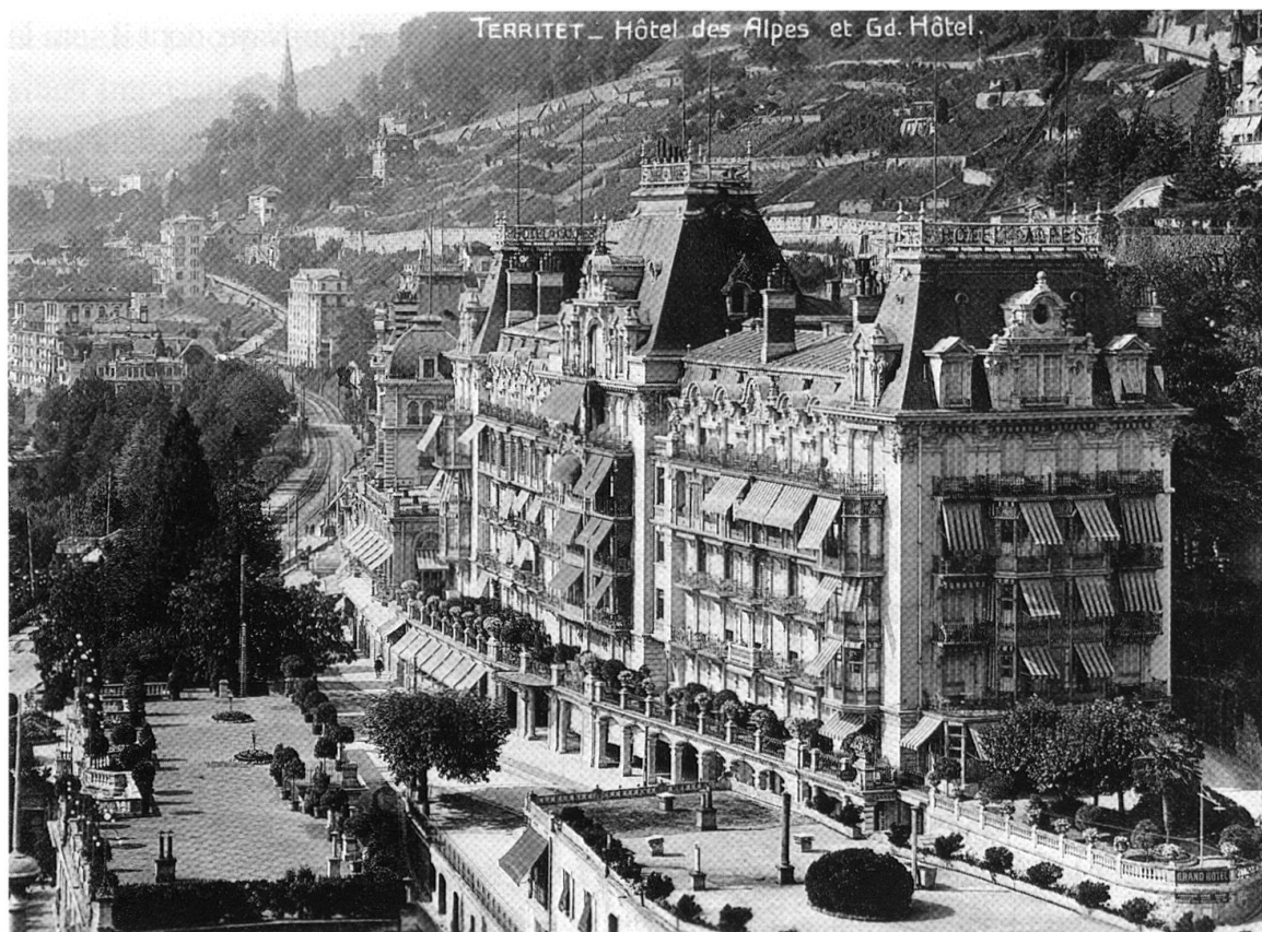
1 Le complexe hôtelier de Territet. Carte postale non datée.

ou villages font partie de ce cercle, dont Territet qui se trouve sur le terrain de la commune des Planches, entre le bord du lac et les hauteurs de Glion et Caux.