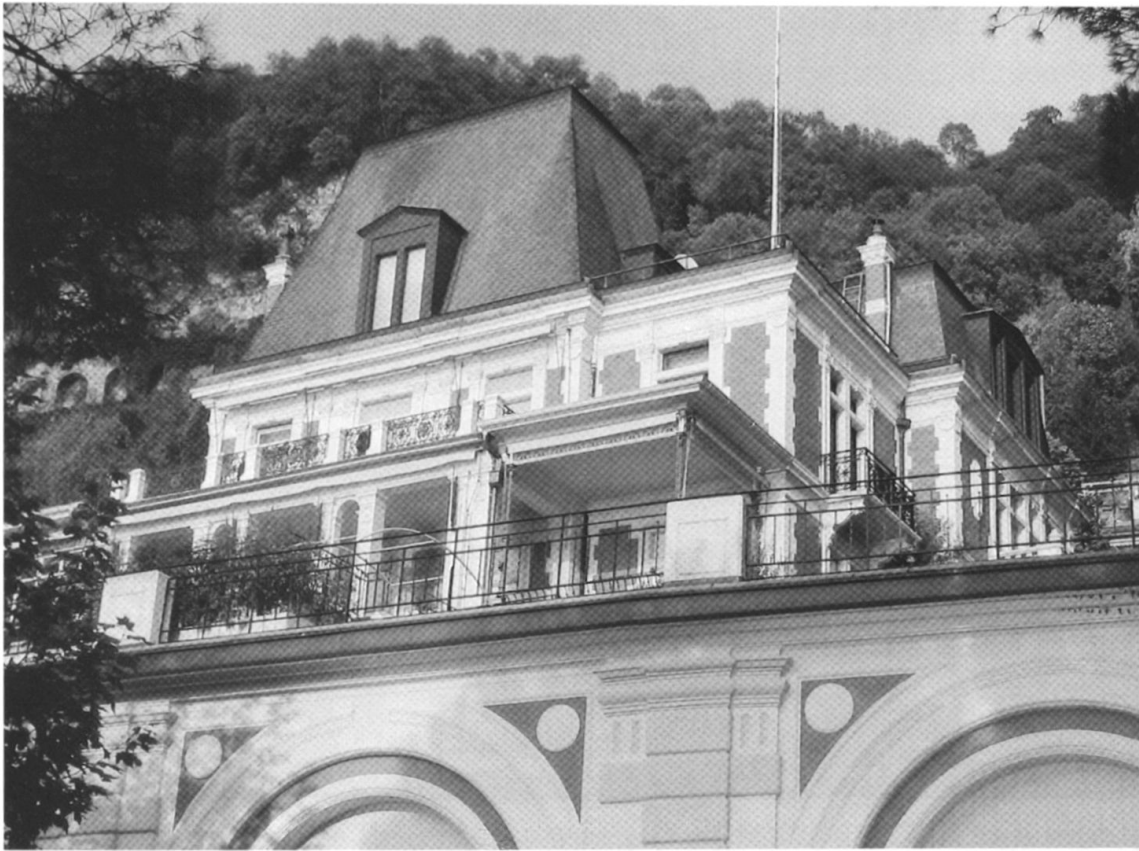
2 La Villa Beauregard en octobre 2002.

que le père d'Ami Chessex décide d'entreprendre des travaux pour rénover et agrandir la petite auberge qu'il possédait, le Chasseur des Alpes, pour en faire un hôtel de plus grande catégorie qui prendra le nom, dès 1855, d'Hôtel des Alpes 10 .