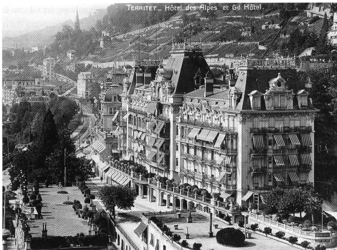
1 Le complexe hôtelier de Territet. Carte postale non datée, Archives de Montreux.

ou villages font partie de ce cercle, dont Territet qui se trouve sur le terrain de la commune des Planches, entre le bord du lac et les hauteurs de Glion et Caux.