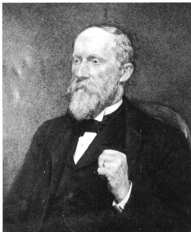
4 Ami Chessex par Frédéric Rouge, huile, vers 1910. Musée de Montreux.

réaliser une fortune, mais aussi de jouer un rôle social en vue, car on lui fait confiance : il acquiert l'appui des plus riches et le respect des plus influents. Grâce à ce réseau, Ami Chessex peut multiplier ses projets.