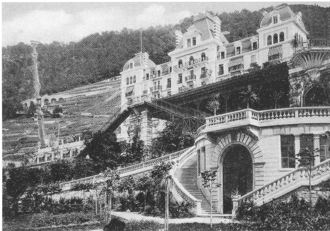
3 Le Grand Hôtel et sa terrasse qui n'existe plus aujourd'hui. Carte postale non datée.