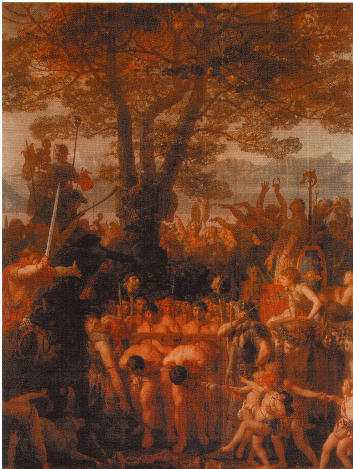
FIGURE 1 Charles Gleyre, La bataille du Léman, ou les Helvètes faisant passer les Romains sous le joug (1858).

L'érudit allemand Theodor Mommsen a démontré en 1857, voire même deux ans auparavant, que la victoire des Helvètes sur les Romains se déroula dans le sud-ouest de la France dans la