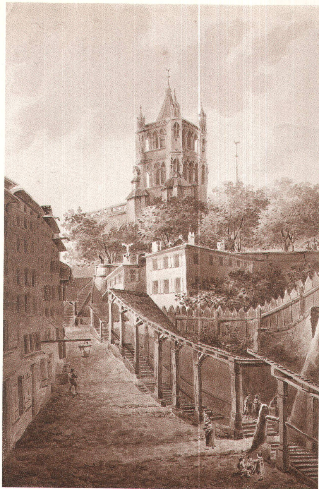
Le beffroi vu des Escaliers du marché, vers 1820 J.-J. Wetzzel, MHAEL Coll. du Vieux-Lausanne, photo A. Held