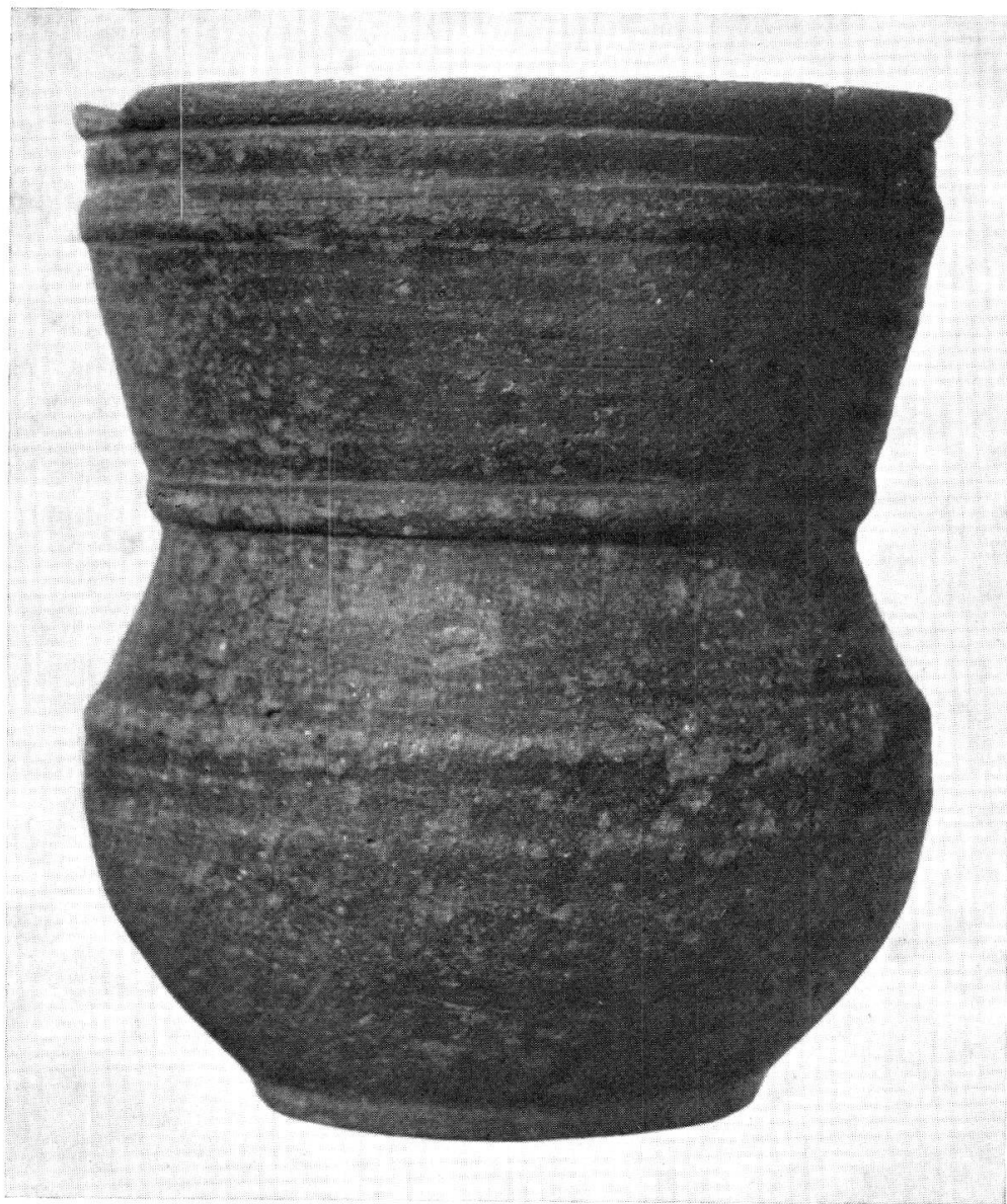
Vase burgonde trouvé dans une tombe découverte à Bex, place du Marché