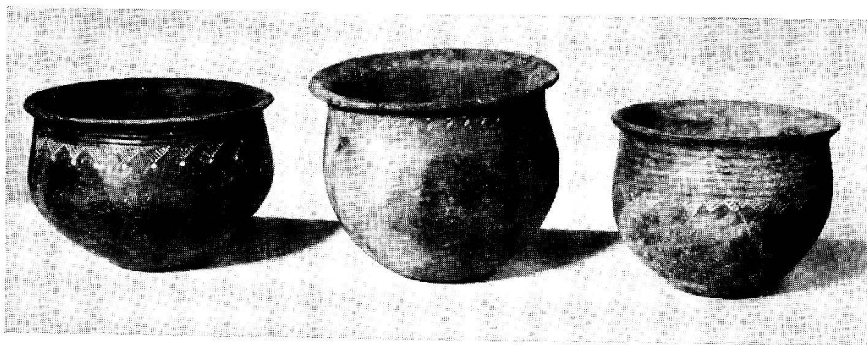
Avenches. — Station de l'Eau-Noire. Poterie noire à décor incisé.