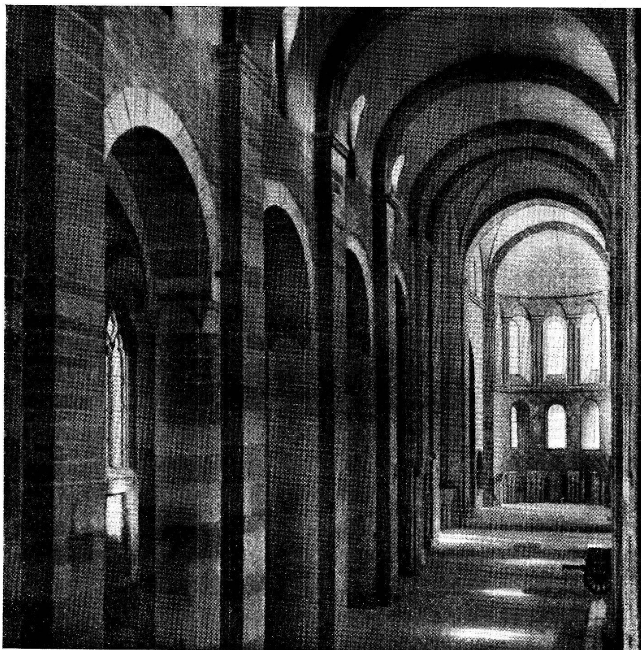
L'Abbatale de Payerne. Vue de la nef et du chœur.

3. Payerne. Abbatale. — Les travaux ont été poursuivis dans la grande nef, qui a été complètement débarrassée des anciens plan-