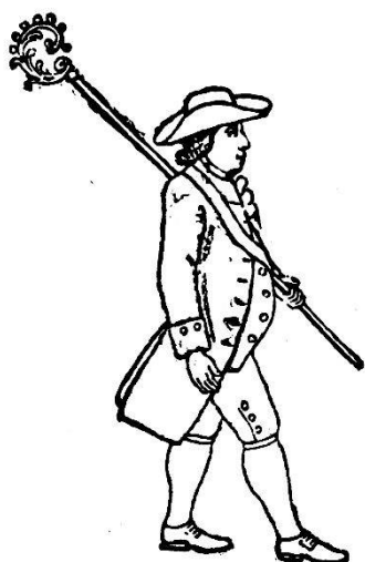
L'Abbé de la Confrérie. Fête de 1797.

personnifier la déesse Cérès. Dès lors, le nombre des personnages représentant les travaux de l'agriculture et de la vigne alla rapidement en augmentant et il fallut ajouter un orchestre qui, en 1755, comprenait huit musi-