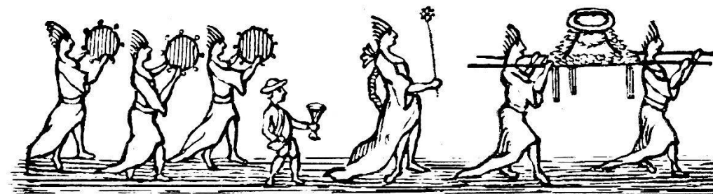
Bacchantes et autel. — Messenger Boiteux de 1778.

Le premier nom porté par l'association fut celui de Confrérie de Saint-Urbain, du nom d'un pape martyr du III me siècle. Cette circonstance nous montre que la Confrérie exis-