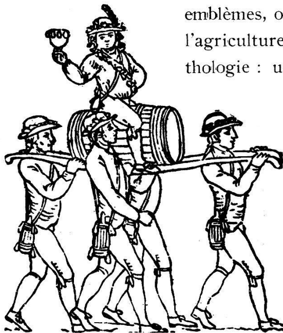
Bacchus. — Fête de 1797.

en 1747, un garçon boucher eut l'honneur de