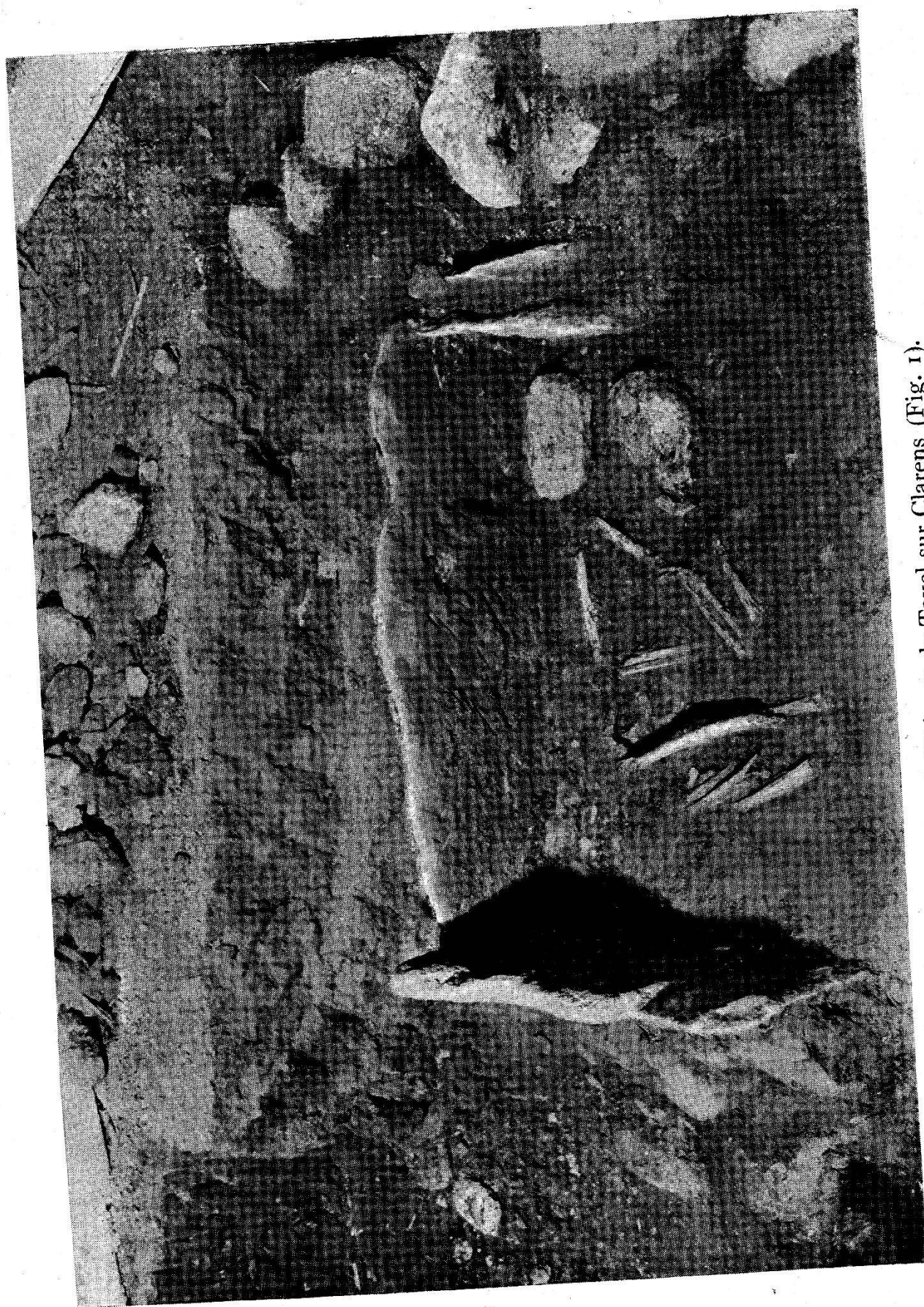
Les tombes néolithiques de Tavel sur Clarens (Fig. 1).