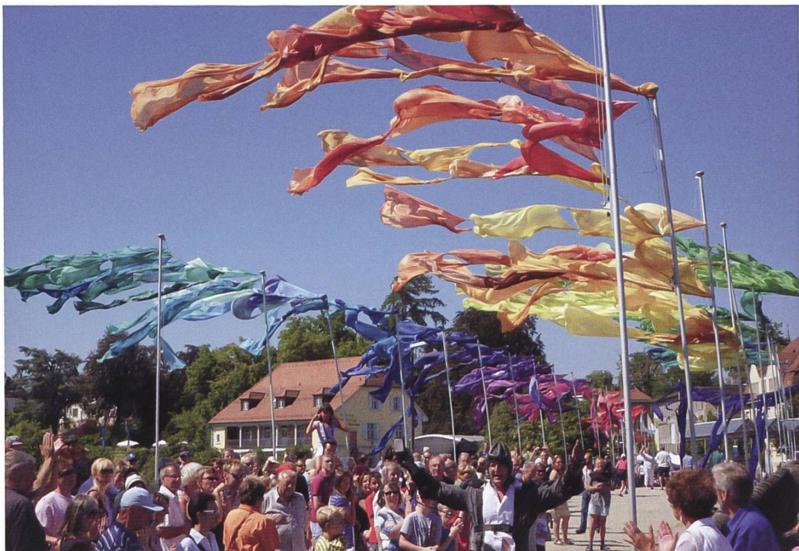
Brückensensationen auf der Rheinbrücke.

Dem rasanten Bevölkerungswachstum ist mit detaillierten Analysen ein eigener Beitrag gewidmet. So war Rheinfelden von Beginn an auch eine Zuwandererstadt mit einem hohen Ausländeranteil von ca. 20 Prozent. Der zweite Teil des Buchtitels heisst entsprechend Integration, da es einer enormen Anstrengung der zusammengewürfelten und heterogenen Einwohnerschaft bedurfte, zusammenzufinden und zusammenzuwachsen. Die Rheinfelder Bürgerschaft hat notgedrungen, da die neuen Aufgaben die noch junge Verwaltung überforderten, das Heft selber in die Hand genommen und sich auf fast allen Gebieten wie Sport, Kultur, Freizeit, Natur, Bildung, Notfallwesen, Religion oder Soziales selbst in Vereinen oder ähnlichen Vereinigungen organisiert und so rasch für die Menschen eine soziale Verankerung geschaffen. Die ersten Wahlen in den 1920er Jahren zeigen bereits, dass fast 90 Prozent der Wähler der demokratischen Mitte zuzuordnen waren. Die Radikalisierung in der Weimarer Republik fand hier nicht statt. Das hohe Engagement der Rheinfelder Zivilgesellschaft für ihre Stadt ist bis heute ein Charakteristikum und Aushängeschild geblieben. Ein eigener Beitrag dokumentiert dieses Netzwerk von kommunaler und bürgerschaftlicher Kooperation der sozialen, engagierten und familienfreundlichen Stadt .