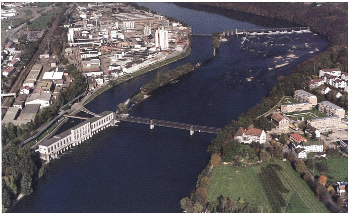
Luftbild mit dem alten Kraftwerk.

Ein Hundert-Jahre-Stadtjubiläum ist im Rahmen von Stadtgeschichten eher ein Ausnahmeereignis. In der Regel gehen Stadtgründungen oder urkundliche Ersterwähnungen auf das Mittelalter oder die frühe Neuzeit zurück. Städte entstanden im Schatten von Burgen, an Handelsplätzen, Furten, an Orten römischer Siedlungen oder wurden von Adligen gegründet. Ein Beispiel dafür ist unsere Partnerstadt, das schweizerische Rheinfelden, als Gründung der Zähringer. Auf der rechten Rheinseite war da zunächst kein Platz für eine weitere Stadt. Erst die Industrialisierung schuf hier andere Voraussetzungen. Wie die meisten Beiträge betonen, war der Nucleus der neuen Ansiedlung der Kraftwerksbau, um den herum sich ein Industriekomplex bildete, der wiederum die Bedingung für das rasche Entstehen einer neuen Siedlung praktisch auf der grünen Wiese war. Diese Stadtentstehung Rheinfeldens ist vergleichbar mit Städten wie Wolfsburg um den Autobauer VW oder Ludwigshafen um die BASF herum.