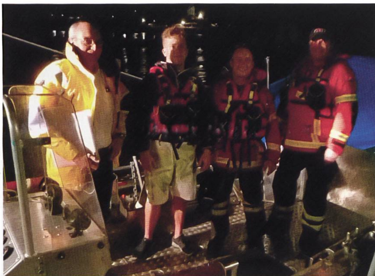
Eine typische Einsatzcrew auf dem Rheinrettungsboot: 2 Bootsführer des RRD sowie 2 reguläre Feuerwehrleute.

Der im Jahr 1968 eingesetzte «professionelle» Rettungsdienst auf dem Rhein agierte bis Ende 1993 selbständig. Per 1. Januar 1994 wurde der Rheinrettungsdienst, kurz RRD, als eigener Fachbereich in die Feuerwehr Rheinfelden integriert und war somit fortan über die Notrufnummer 118 erreichbar. Grundsätzlich ist im Kanton Aargau der Wassereinsatz Sache der Kantonspolizei, welche auf dem Hallwilersee über ein Boot der Gewässerschutzpolizei verfügt. Der Rheinrettungsdienst wiederum muss somit als Unikum in der Blaulichtlandschaft des Kantons Aargau gesehen werden – mitunter ein sehr erfolgreiches Unikum. Der RRD kommt immer dann zum Einsatz, wenn es gilt, Mensch und Tier zu retten oder Material zu bergen. Er bietet zudem Hilfestellung bei Einsätzen der Feuerwehr z.B. bei einem Brand in der Altstadt und hat die Möglichkeit, eine Motorspritze mit einem Wasserwerfer einzusetzen. Die meisten Einsätze umfassen Suchaktionen nach Personen oder Material. Der Bootsführer ist verantwortlich für das Boot und seine Besatzung. Alle Mitglieder vom Rheinrettungsdienst sind als Bootsführer auf Fliessgewässer ausgebildet und verfügen über fundierte Kenntnisse in der Ersten Hilfe wie auch in der Reanimation von Personen.