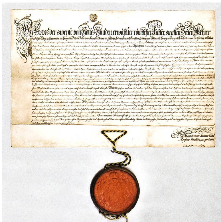
Der letzte Freiheitsbrief für Rheinfelden, ausgestellt 1793 von Franz II., dem letzten Kaiser des Heiligen Römischen Reiches.

Kaiser Franz II. von Habsburg-Lothringen, ein Enkel der Kaiserin Maria Theresia, wurde 1792 im Frankfurter Dom gekrönt. 1806 legte er die Kaiserkrone nieder und setzte dem Heiligen Römischen Reich ein Ende. Damit wollte er u.a. verhindern, dass sein Hauptgegner Napoleon Bonaparte nach der altherwürdigen Kaiserkrone und dem deutschen Kaiseramt greifen konnte. Doch trug Franz weiterhin den Kaisertitel: 1804 hatte er sich zum Kaiser Franz I. von Österreich erklärt. 1918 endete auch dieses Kaiserreich.