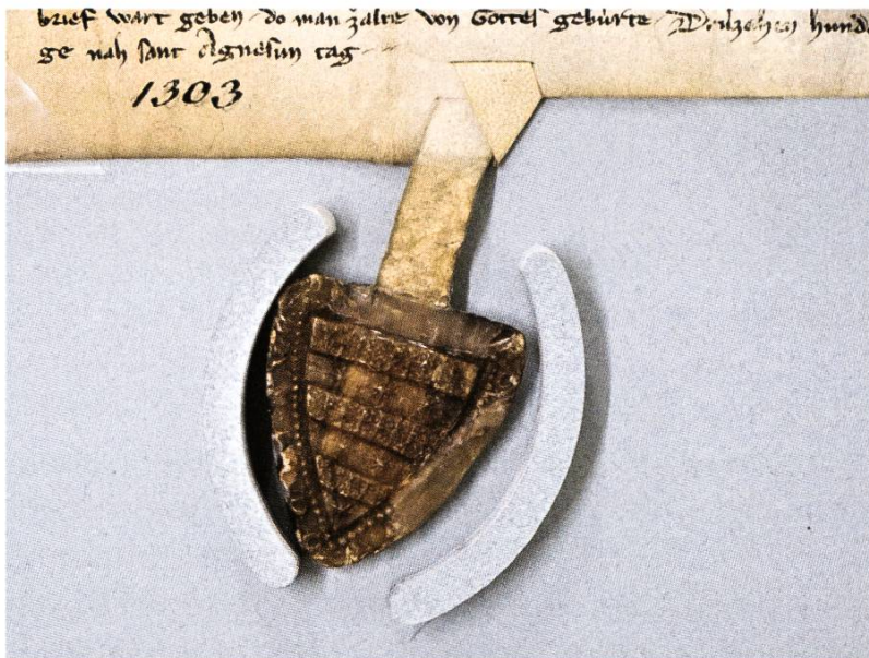
Das älteste Stadtsiegel im Stadtarchiv an einer Urkunde von 1303.

Der Inhalt der Urkunde vom 25. Januar 1303 3 soll uns hier nicht weiter beschäftigen. Im Text werden u.a. Rechte an Liegenschaften in Degerfelden und Rheinfeldern festgehalten, in diesem Zusammenhang treffen wir auch auf die wohl früheste Erwähnung der Kupfergasse. Unser Augenmerk richtet sich auf das am Schriftstück hängende Siegel.