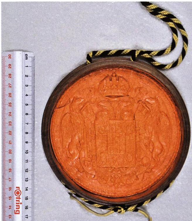
Das eindrückliche Siegel von Kaiser Franz II.

Von Kaiser Franz II. erhielt Rheinfelden seinen letzten, die Rechte der Stadt bestätigenden Freiheitsbrief 9 , ausgestellt am 11. Oktober 1793 von der Hofkanzlei in Wien. Die Urkunde beginnt mit einer, allerdings unvollständigen Aufzählung der Titel des Habsburgers: «Wir Franz der zweyte, von gottes Gnaden erwählter römischer kaiser, zu allen zeiten mehrer des reichs, könig in Germanien, zu Hungarn, Böhmeim, Dalmazien, Kroazien, Slavonien, Galizien, Lodomerien und Jerusalem, erzherzog zu Oesterreich, herzog zu Burgund und zu Lothringen, grossherzog zu Toskana, grossfürst zu Siebenbürgen, herzog zu Mailand, Mantua, Parma, gefürsteter graf zu Habsburg, zu Flandern, zu Tyrol etc. etc.» Die Pergamenturkunde misst beachtliche 72 x 48 cm und besitzt ein Siegel von eindrücklicher Grösse. Es ist mit einer schwarz-gelben Schnur am Dokument befestigt, deren Farben sich auf das Reichswappen – in Gold ein schwarzer (Doppel-)Adler – beziehen.