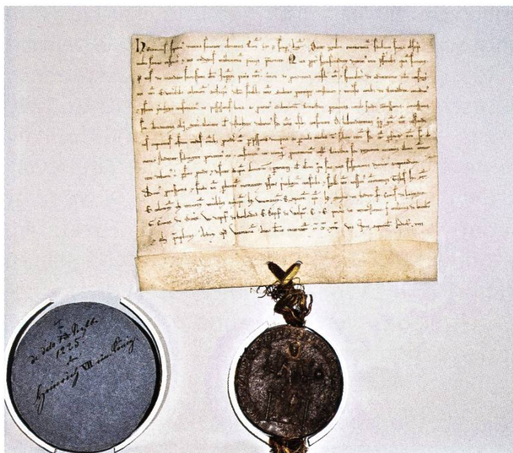
Das älteste Schriftstück des Stadtarchivs: Urkunde von König Heinrich VII. aus dem Jahr 1225.

Leider findet sich im Stadtarchiv kein Schriftstück aus der Zeit der Grafen von Rheinfelden, die im 11. Jahrhundert hier ansässig waren und deren bekanntester Vertreter König Rudolf von Rheinfelden war. Auch aus der nachfolgenden zähringischen Epoche (ca. 1190 bis 1218) liegt kein Dokument vor – bedauerlich, waren es doch die Zähringer, die Rheinfelden ab etwa 1130 zur Stadt ausbauten.