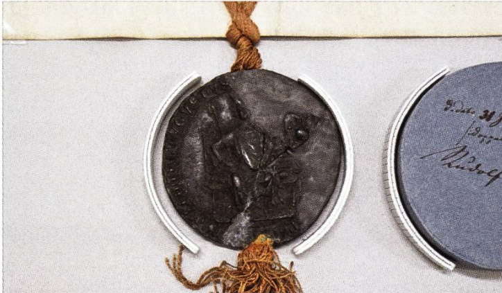
Beschädigtes, bei der Restaurierung mit Wachs stabilisiertes Siegel von König Rudolf I. von Habsburg aus dem Jahr 1276.

steht das Siegel von König Rudolf I. von Habsburg aus dem Jahr 1276 4 : Fehlende Teile wurden mit Wachs ergänzt, der aus 80% gebleichtem Bienenwachs und 20% Dammarharz hergestellt und mit Pigmentfarben gefärbt wurde. 5