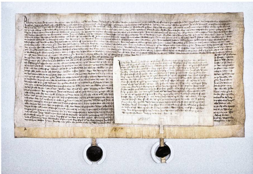
Zusammengefügte Urkunden von 1387/88.