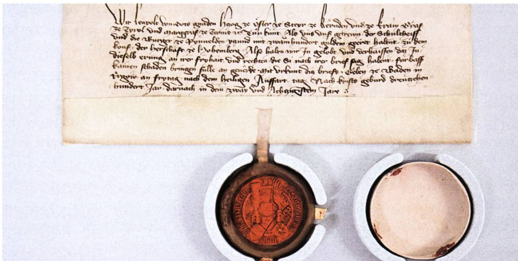
1382 im Namen von Herzog Leopold III. von Österreich in Baden ausgestellte Urkunde.

Am 9. Juli 1386 brachten die Eidgenossen bei Sempach in einer denkwürdigen Schlacht dem habsburgischen Heer eine folgenschwere Niederlage bei. Herzog Leopold III., Anführer der habsburgischen Truppen, fiel auf dem Schlachtfeld. Das Stadtarchiv beherbergt ein Dokument 6 , das Leopold vier Jahre vor seinem Tod ausstellen liess.