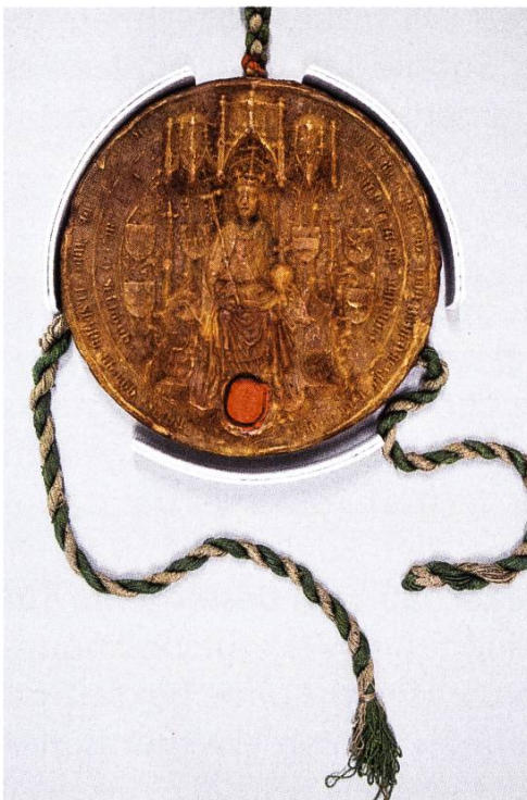
Siegel von König Friedrich III. von 1449 mit eingedrücktem Sekretsiegel.

Am 26. Mai 1449 stellte König Friedrich III. (ab 1452 Kaiser) aus dem Hause Habsburg in Graz der Stadt Rheinfelden einen Freiheitsbrief 8 aus. Darin bestätigt er dem Schultheissen, dem Rat, den Zunftmeistern, den Bürgern und der ganzen Gemeinde zu Rheinfelden Freiheiten und Rechte, die sie von den Kaisern und Königen und von den Fürsten des Hauses Habsburg erhalten haben. Am Schriftstück hängt