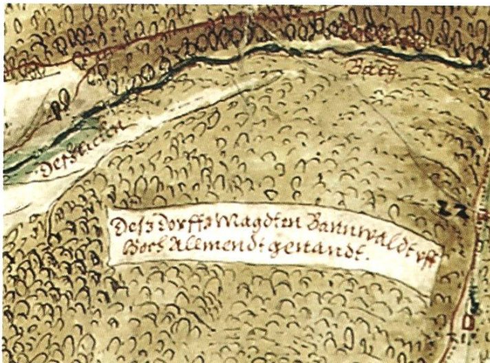
Ausschnitt «Deschliker Bach» auf dem Grenzplan Basel-Österreich von 1602 (Staatsarchiv BL KP_5001_0004).