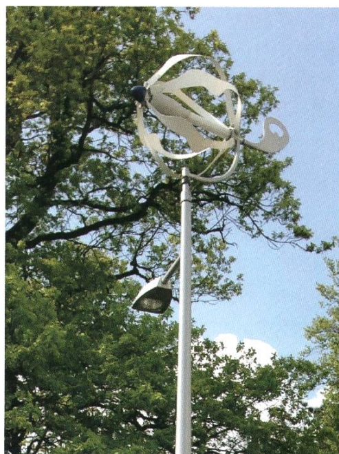
Der Energy-Ball auf einem Kandelaber an der Roberstenstrasse

Das Niederspannungsnetz ab der TS Kreuzmatt ist strahlenförmig aufgebaut. Eine Variante zum Aufbau des Stromnetzes ist eine Vermaschung, d.h. zwei oder mehrere Strahlen werden dabei quer miteinander verbunden. In einem gross angelegten Test wurde der Einfluss einer solchen Masche mit Einbezug sämtlicher verfügbaren dezentralen Einspeisungen gemessen und analysiert. Die Maschenbildung erfolgte von der VK Parkweg zur VK Roberstenstrasse mittels eines Kabels für Baustromversorgung und war gut sichtbar.