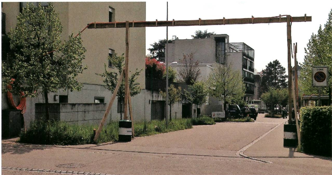
Kabelüberführung bei der VK Parkweg während dem Test mit der Vermaschung

Zusätzlich zu den Anlagen werden auch die Erkenntnisse aus VEiN weiter genutzt werden können. So konnten mit VEiN einige theoretische Aussagen zur dezentralen Stromeinspeisung bestätigt und gefestigt werden, dank denen die Verteilnetzbetreiber nun die Gewiss-