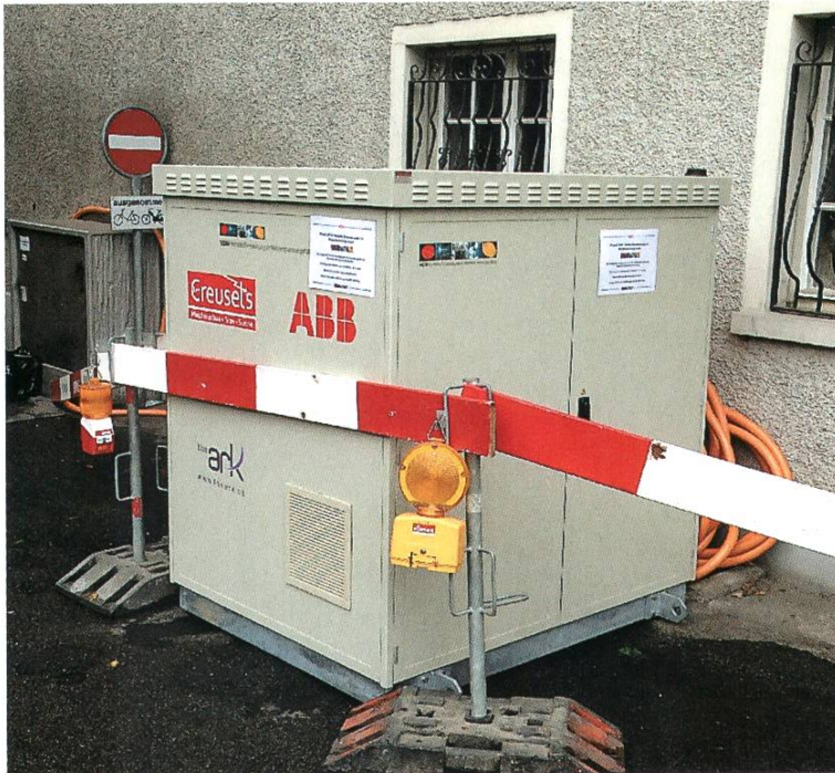
Der mobile Frequenzumformer im Einsatz bei der Verteilkabine VK Johannitergasse in der Altstadt

Im Testnetz von VEiN wurden weitere technische Anlagen zur Beherrschung der vermehrten dezentralen Einspeisungen eingesetzt. Dies ist zum einen ein regulierender Transformator in der TS Kreuzmatt, der abhängig von der Last der Verbraucher und der Stromeinspeisung ab den PV-Anlagen oder den Blockheizkraftwerken die Spannung regelt, so dass die Spannungsnorm eingehalten wird und die Endverbraucher nichts von der neuen Situation mit vermehrter dezentraler Einspeisung feststellen. Dieselbe Funktion erfüllt ein Längsregler, jedoch nicht für das gesamte Niederspannungsnetz, sondern lokal, an dem Ort, wo er platziert wird. In VEiN war im Sommer 2016 ein Längsregler bei der VK Roberstenstrasse im Einsatz, um die Spannungsschwankungen auszuregeln, die von den beiden grossen PV-Anlagen beim Mehrfamilienhaus Zähringer und beim Parkhaus Kurzentrum verursacht wurden.