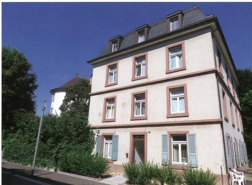
Aktuelles Foto der heutigen Asylunterkunft am Schützenweg 7