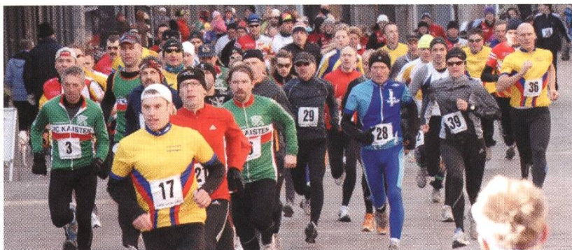
Der Fricktaler-Cup als Rheinfelder Stadtlauf