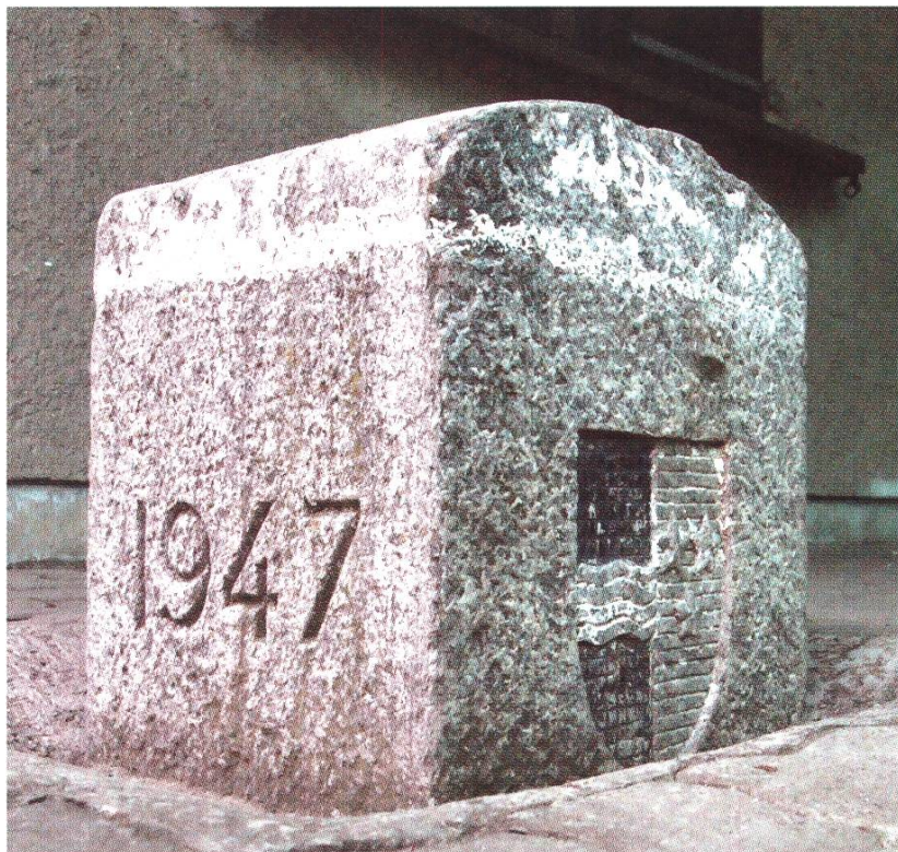
Ein Grenzstein neben dem Turm markiert die Kantonsgrenze.

Blitz und Ungewitter zu beschützen und zu bewahren, um es der Nachwelt überliefern zu können. Das walte Gott!»