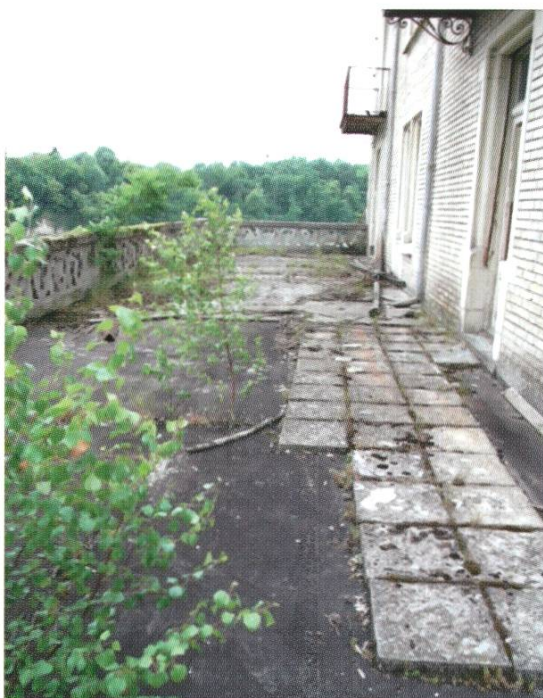
Die Terrasse vor der Renovation.

Der Dornröschenschlaf des unter Denkmalschutz stehenden Gebäudes ist beendet. Heute beherbergt es 14 stilvoll eingerichtete Einzelzimmer, darunter vier Suiten mit jeweils luxuriösen Badezimmern, Balkonen oder Ausblicken auf den Rhein. «Alles auf höchstem Fünf-Sterne-Niveau. Ein Qualitätsprädikat, das auch für Essen, Lobby und Lounges im Erdgeschoss gilt», unterstreicht Jürg Eichenberger, der in diesem Zusammenhang natürlich nicht die idyllische Flusslandschaft