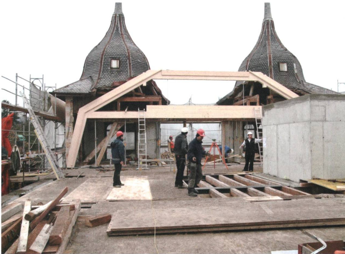
Der neue Dachstock wird gestellt.

und die Parkanlagen sowie die nahegelegene historische Altstadt vergisst, wenn Patientinnen und Patienten erholsame Spaziergänge unternehmen möchten.