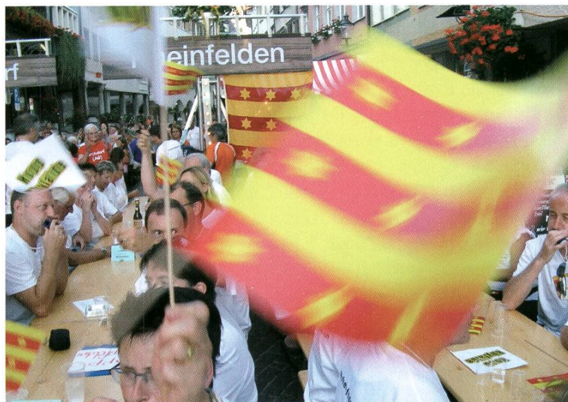
Rheinfelden zu Gast in Schweizer Fernsehstuben: «Donnschtig-Jass» aus dem Städtli.