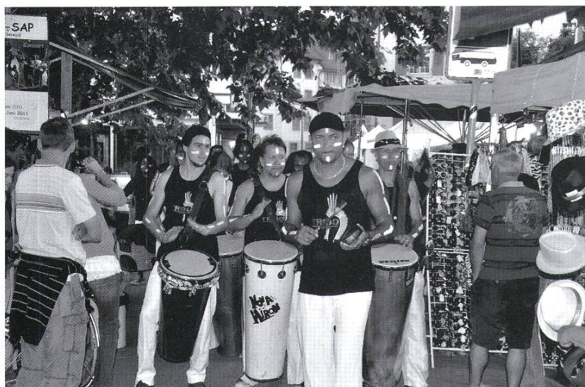
Bringt Freude und Atmosphäre ins Städtli, das Festival der Kulturen.