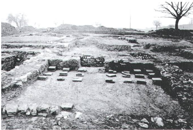
Gesamtansicht der römischen Villa auf dem Betberg

Dass nach den Römern im 4. Jahrhundert n. Chr. die alemannische Einwanderung auch bei uns stattfand, beweist das 1932 auf der Obermatt ausgegrabene alemannische Steinkissengrab.