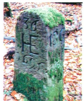
Grenzstein im «Güeterbüelgrabe», Jahrzahl 1695, Kennzeichen HE für Hefflingen.

Bild Seite 165: Höflingen zwischen Rheinfelden und Magden links des Magdener Bachs. Ausschnitt aus dem «Grenzplan Basel-Österreich» (1602) von M.H. Graber (Staatsarchiv BL, KP 5001 0004).