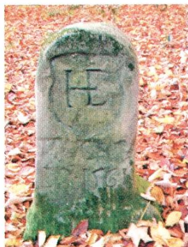
Grenzstein im «Junkereholz», Jahrzahl 1561, Kennzeichen HE für Hefflingen.