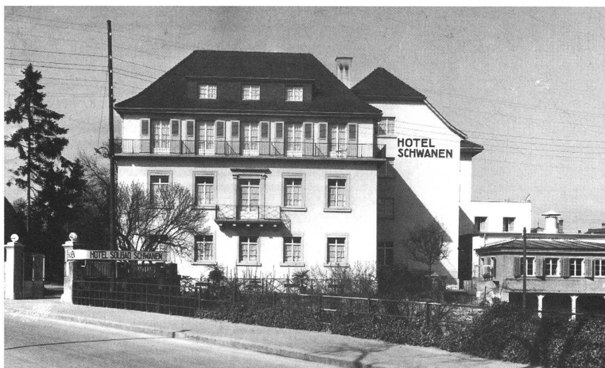
VI. Hotel Schwanen nach 1932.