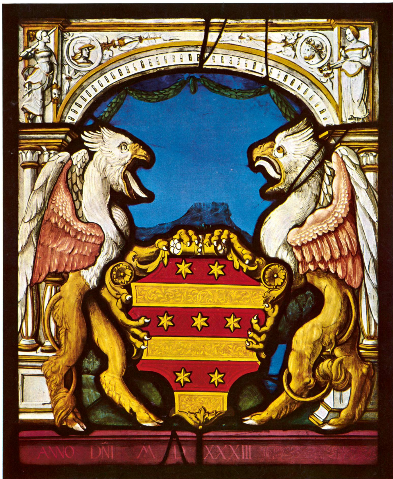
Rheinfelder Neujahrsblätter 1994