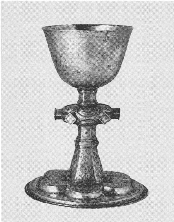
Kelch aus dem Stiftsschatz von St. Martin um 1600