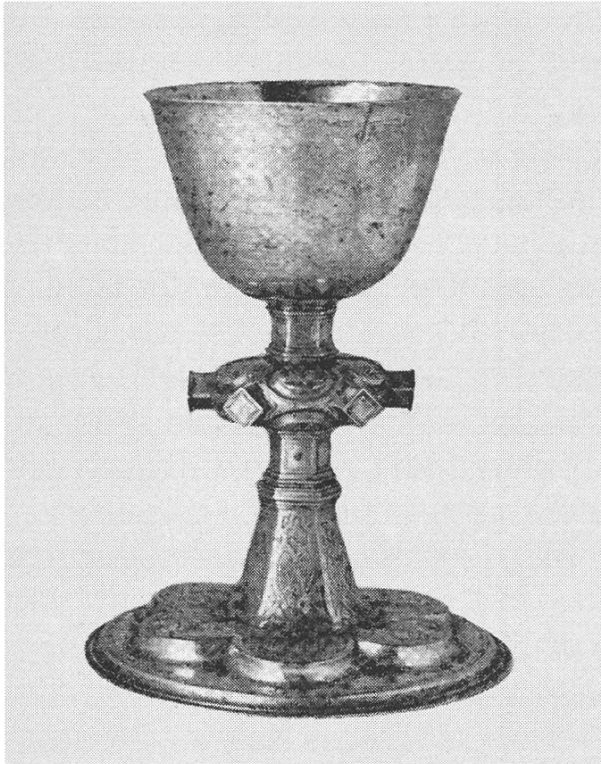
Kelch aus dem Stiftsschatz von St. Martin um 1600