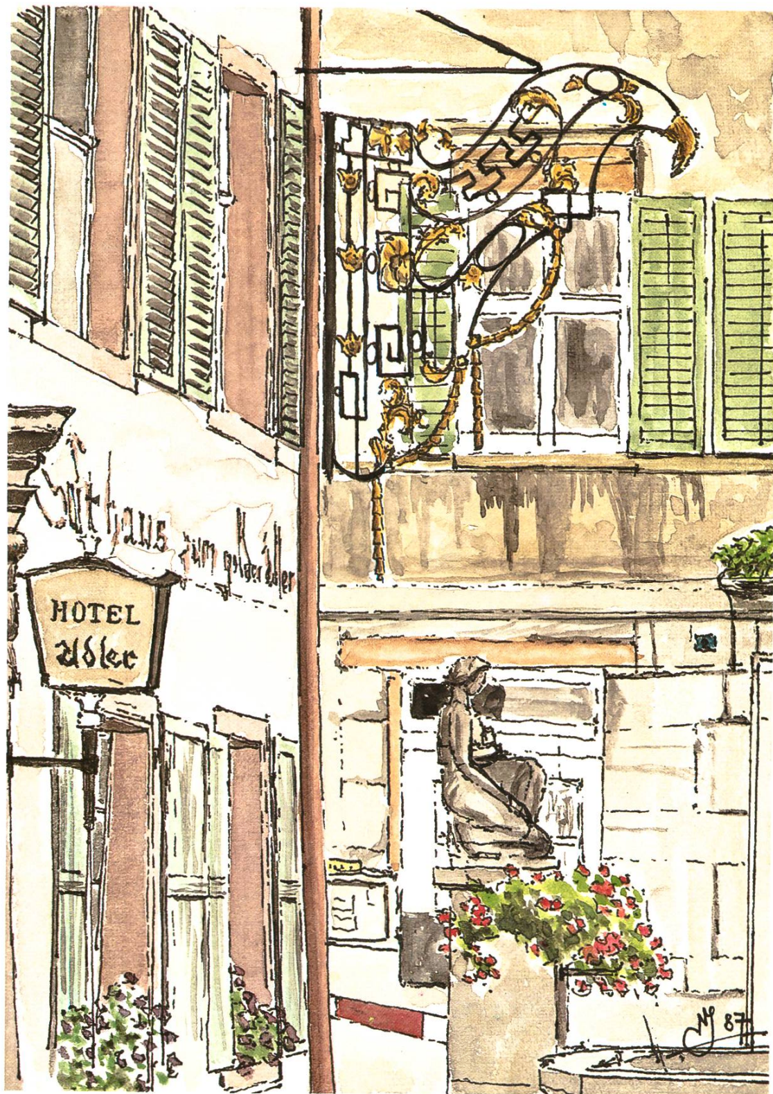
Auf dem Obertorplatz