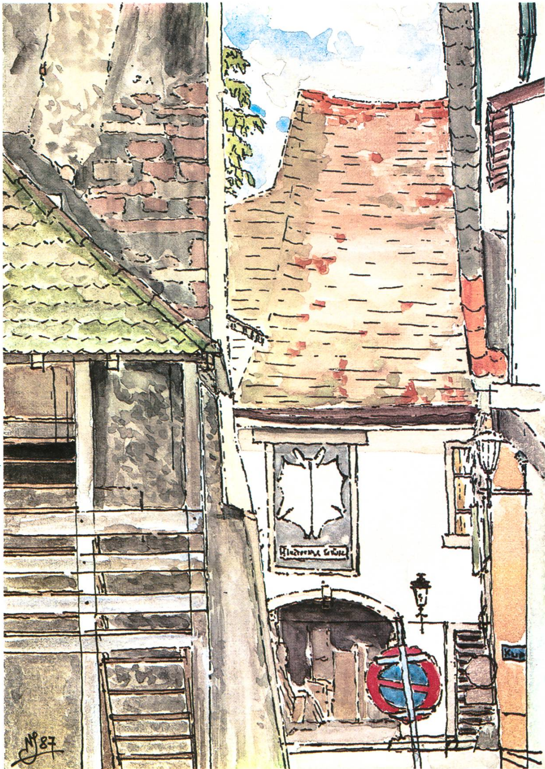
Blick zur Fledermausscheune