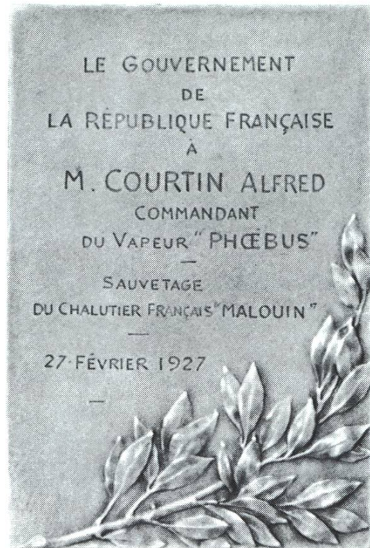
Silberplakette, gegeben durch den französischen Generalkonsul in Hamburg, Saugon, für die Rettung der 53 französischen Seeleute.

mein Vater bis zu seiner Pensionierung 1932, nach 40jähriger Dienstzeit bei der gleichen Reederei, die mehrfach den Namen gewechselt hatte.