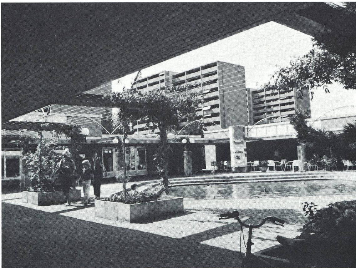
Abbildung 15 Das Augartenzentrum mit Läden, Restaurant und oekumenischem Haus der Kirchen ist ein wichtiger Treffpunkt in der Siedlung.