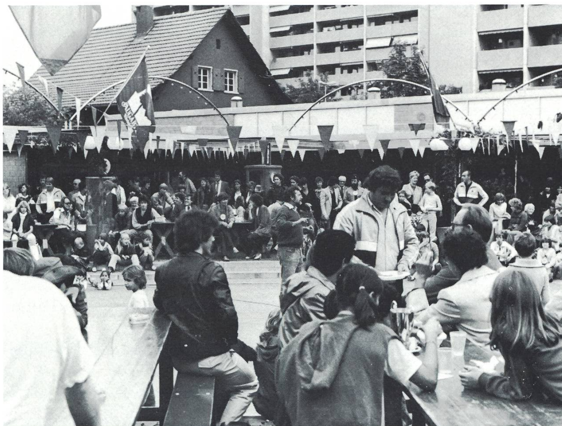
Abbildung 19 Am Fest zugunsten der Behinderten von Rheinfelden wurde der Augarten zum Treffpunkt für die ganze Bevölkerung.