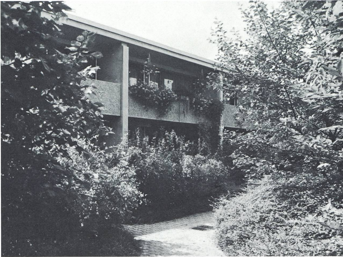
Abbildung 14 Viele Hobbygärtner haben dazu beigetragen, den Augarten zu einem üppigen Garten zu machen. Hier: Eingangspartie zu Reiheneinfamilienhäusern.