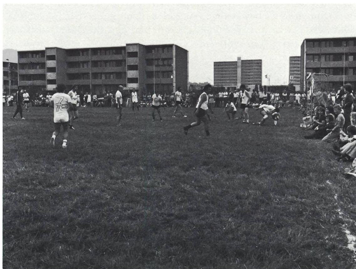
Abbildung 17 Anlässlich der festlichen Einweihung des Augartenschulhauses im August 1974 wurde auch ein Fussballwettkampf zwischen Behörden und Lehrern mit Zuzug ausgetragen.