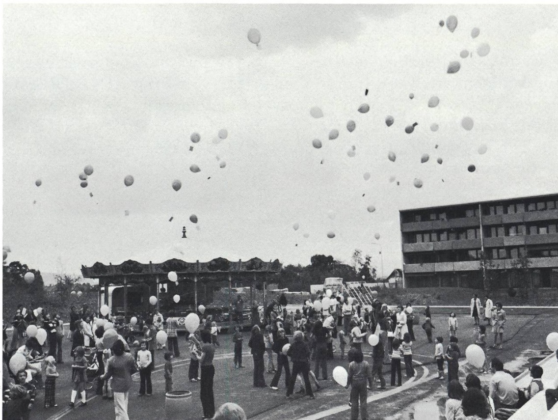
Abbildung 16 Ballonstart auf dem Hartplatz des Schulhauses anlässlich des Festes zur Feier der «halben Bauzeit» im Juni 1974.