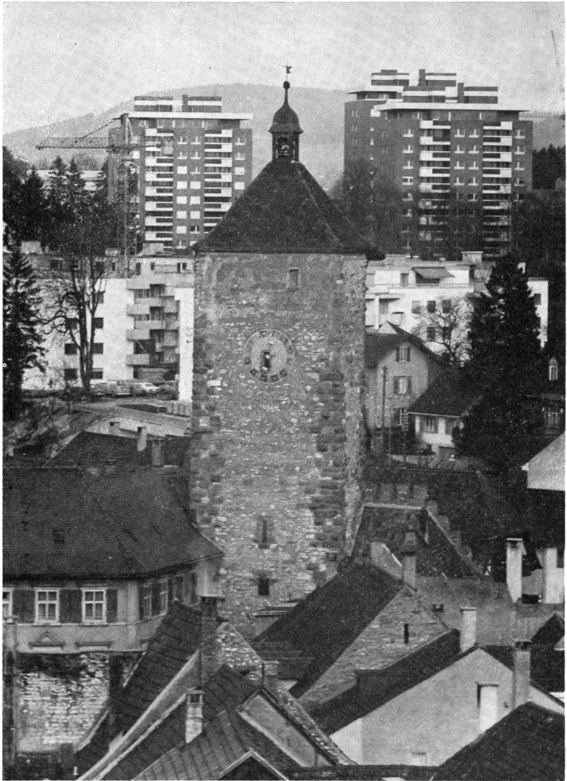
Fotowettbewerb EZA 3. Preis (R. Baumann-von der Crone, Magden)