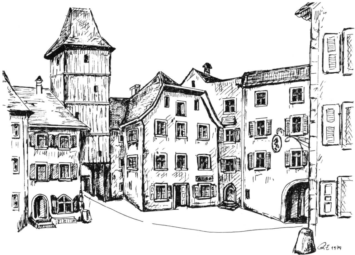
Das Haus zum «Meergott» 1690–1744 mit dem Rheintor. Das Gasthaus zum «Schiff» begann erst innerhalb des Schwibbogens