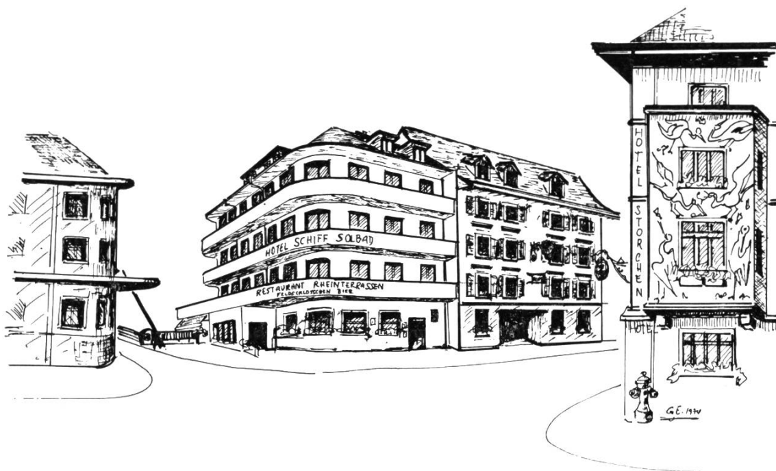
Hotel «Schiff» 1932–1966