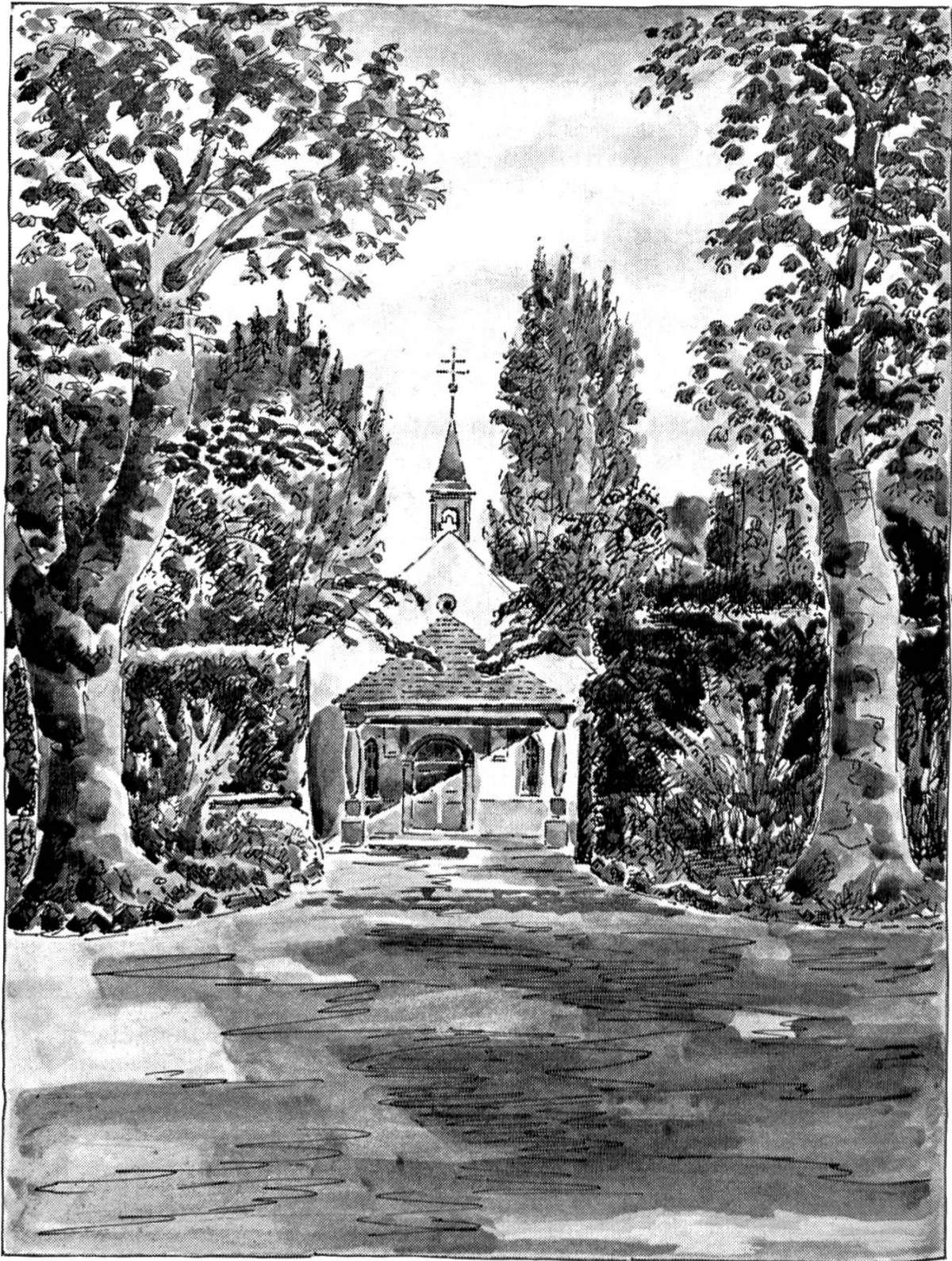
Die Gottesackerkapelle nach einer Zeichnung von Wyss. (Eigencliché.)