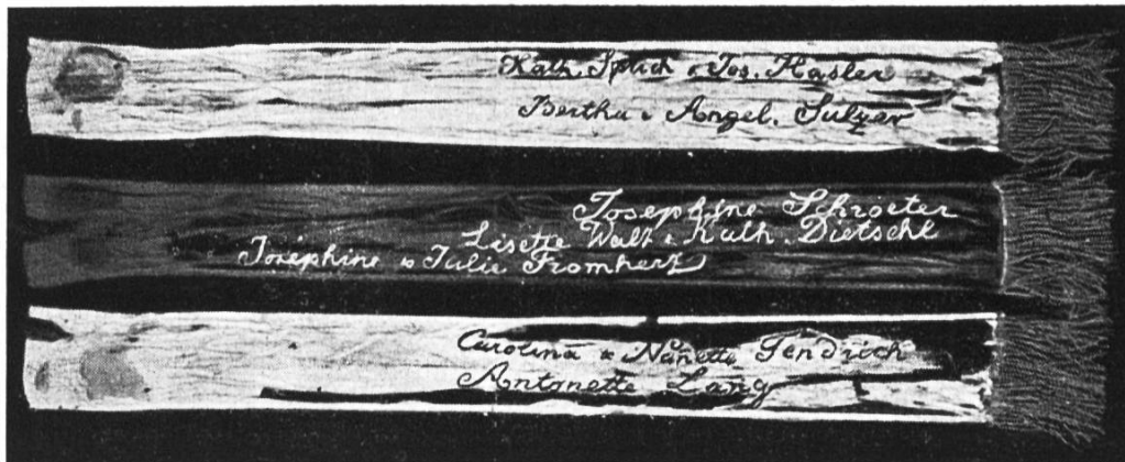
Reste der ersten Kadettenfahne von Rheinfelden Schleife mit den Namen der Stifterinnen

Es war, wie's im Bericht der «Neuen Rheinfelder Zeitung» stand, ein unmilitärisches und darum recht fröhliches und unbeschwertes Rheinfelder Kadettenfest. LA