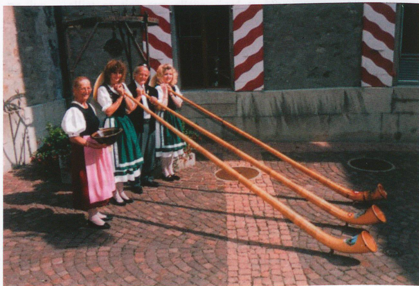
Chacun son rôle et les vaches seront bien gardées

Ces particularismes obligent le management à s'appuyer sur des valeurs radicalement différentes. Les valeurs de sérieux, de persévérance et d'efficacité sont bien sûr présentes. Mais celles d'ordre et de mesure sont surpondérées dans les réponses aux enquêtes. Le sens du « moitié-moitié » est quasiment inné. On trouve également la prudence, et la recherche de sécurité – on ne prend une décision qu'après s'être assuré qu'on peut assumer toutes les conséquences du scénario le moins optimiste. Pas étonnant que ce soit le pays le plus assuré au monde. Et si cette culture de management brille à éviter les excès