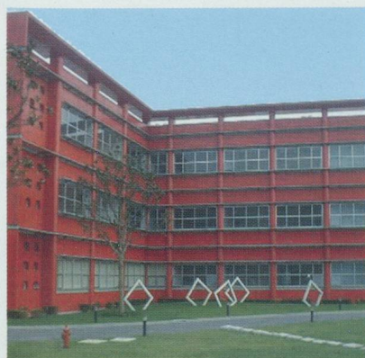
Bâtiment administratif du Swiss Center Shanghai

Le Swiss Center Shanghai (SCS) est une réalisation d'une importance considérable pour la Chambre fribourgeoise du commerce, de l'industrie et des services, mais aussi pour l'ensemble des Chambres de commerce régionales en Suisse. Ce centre est en effet la réponse pratique au besoin exprimé par de nombreuses petites et moyennes entreprises suisses qui souhaitent être guidées de manière professionnelle, peu coûteuse et performante dans leur approche du marché chinois. Ce projet favorise le développement des réseaux internationaux des PME suisses.