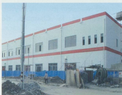
Bâtiment industriel du Swiss Center Shanghai

L'équipe du SCS accompagne les entreprises dans toutes leurs démarches et les assiste dans la mise en œuvre et la gestion globale du projet. De par sa conception, le SCS permet à l'entreprise de choisir elle-même son entrée sur le marché chinois: par une vitrine d'exposition, une