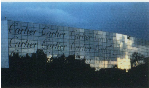
Cartier : le centre international de logistique