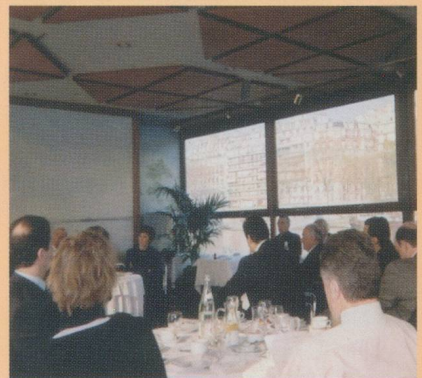
Les petits-déjeuners parisiens rencontrent un succès croissant

société), apporte véritablement une solution apaisante aux victimes.