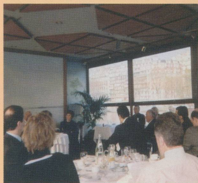
Les petits-déjeuners parisiens rencontrent un succès croissant

société), apporte véritablement une solution apaisante aux victimes.