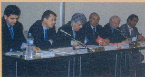
Les intervenants de la réunion organisée à Arles