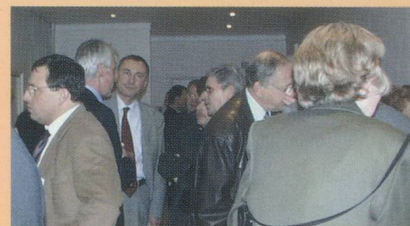
Le cocktail qui a suivi le débat du 13 novembre