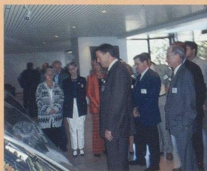
Découverte du site de FAVERGES