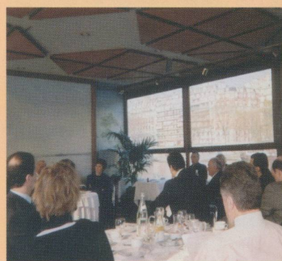
Les petits-déjeuners parisiens rencontrent un succès croissant

société), apporte véritablement une solution apaisante aux victimes.