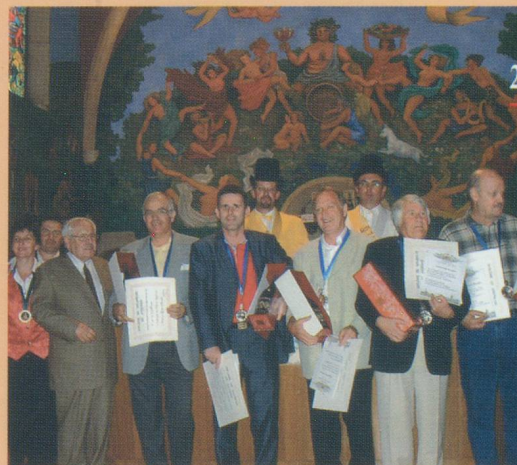
Les nouveaux intronisés