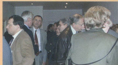
Le cocktail qui a suivi le débat du 13 novembre