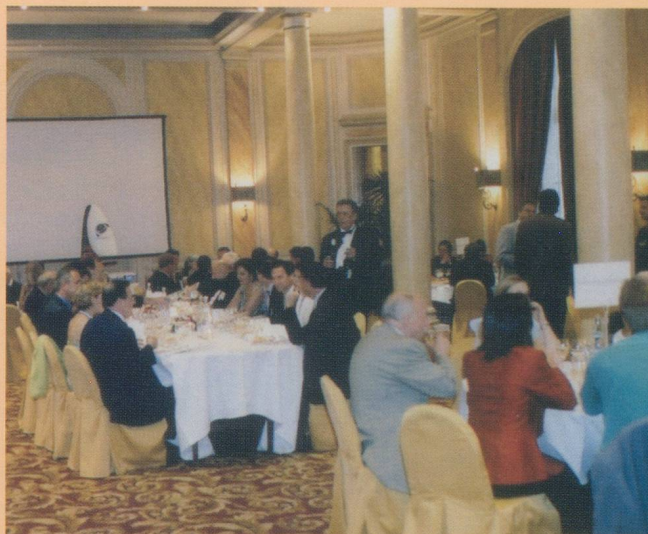
Près d'une centaine de participants à l'Hôtel Royal Monceau