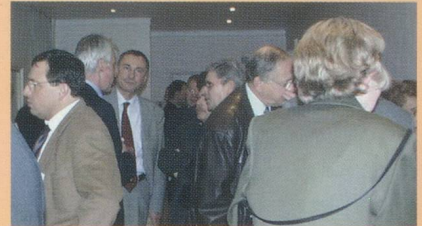
Le cocktail qui a suivi le débat du 13 novembre