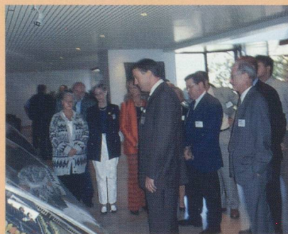
Découverte du site de FAVERGE

Pour ne pas être tributaire d'une seule activité et de ses cycles temporels, plusieurs diversifications ont vu le jour durant les dernières décennies ; c'est ainsi que la robotique et la connectique sont venues compléter l'activité du groupe. Les membres de la Chambre remercient tout particulièrement Monsieur STÄUBLI et ses cadres dirigeants pour leur disponibilité et la qualité de leur réception. Les Etablissements STÄUBLI sont adhérents à la CCSF depuis plus de 75 ans.