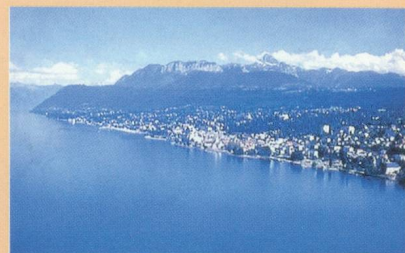
Soirée du 24 avril à Evian