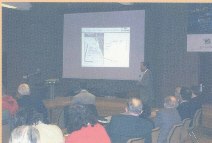
Soirée conférence à l'université de Haute-Alsace

rentrée. Parmi celles-ci, le 29 septembre prochain, une conférence sur le thème de " l'export, un enjeu pour les PME – Nouvelles idées de coopération et