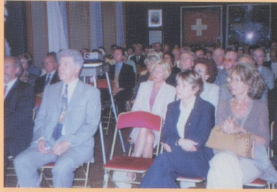
L'assistance est attentive