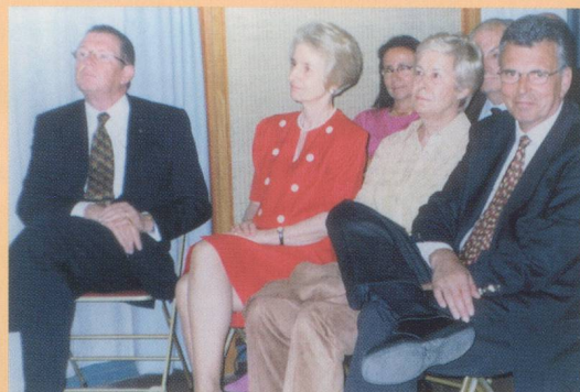
Conférence du 12 mai dernier