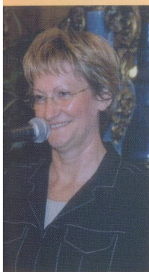
Madame Nicole Notat, Présidente de la Société VIGEO

Pour participer aux rencontres de la CCSF Ile-de-France : Chambre de Commerce Suisse en France Région Ile-de-France 10, rue des Messageries 75010 Paris Tél. 01 48 01 80 15 / Fax 01 48 01 80 16 E-mail : iledefrance@ccsf.com