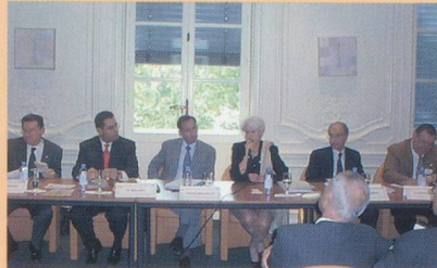
Conférence débat du 15 mai 2003 au siège du Crédit Agricole