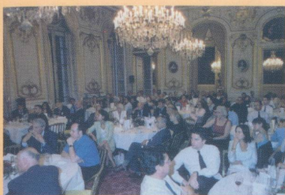
Dîner prestige au Sénat