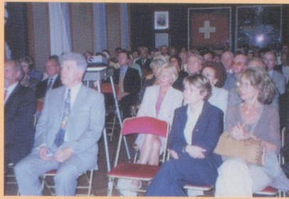
L'assistance est attentive

Penthes, à Pregny-Chambésy, aux portes du quartier international de Genève. Monsieur de Tschärner a ensuite évoqué l'Institut des Suisses dans le monde, ainsi que la Fondation pour l'histoire des Suisses dans le monde, association qu'il préside. Il a terminé son exposé en appelant les participants à faire connaître cette association et à aider le musée à trouver des objets et des documents concernant l'histoire des Suisses dans le monde. Enfin, il a conclu en invitant les participants à aller visiter le musée de Penthes. Le 5 juin dernier, sur proposition du Club franco-allemand et du Groupement des Intérêts Scandinaves en Provence (GISEP), la CCSF Marseille Sud-