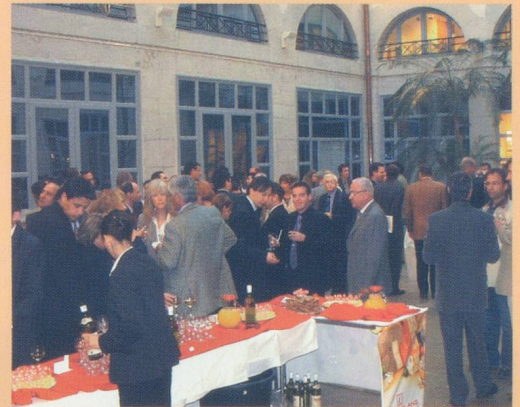
Le cocktail qui a suivi la conférence du 15 mai dernier

Le cocktail qui clôturait cette manifestation a ensuite été l'occasion de discussions plus personnalisées, permettant ainsi de lever bien des ambiguïtés.