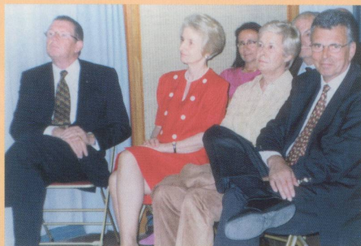
Conférence du 12 mai dernier