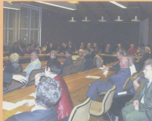
Une centaine de participants, le 13 mars dernier

employeur de la région. Cependant, Monsieur BANGRATZ n'a pas caché les incertitudes liées à