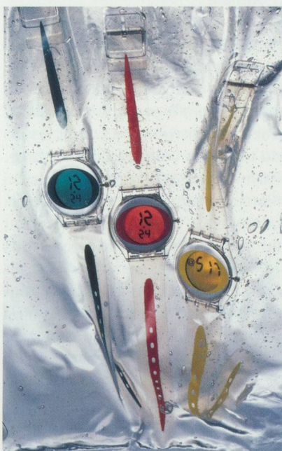
Montres montyway, space cherry et straight lime de swatch © Swatch