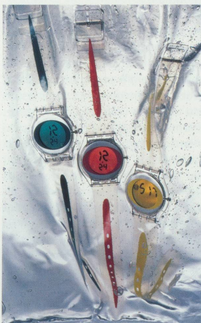
Montres montyway, space cherry et straight lime de swatch © Swatch