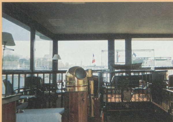
Péniche du Cercle de la Mer

présenté devant les adhérents de la CCSF, la spécificité de cette Suisse allemande difficile à appréhender de l'extérieur. Scindée en quatre parties : " Une " Suisse allemande ? " (une confédération de régions à fortes identités) ; " Le travail " (le triomphe de l'éthique protestante - La notion de compromis) ; " Le contact, le travail et l'après travail ", cette rencontre a eu un tel succès qu'elle sera reprise par la Région Rhône-Alpes Auvergne de la CCSF en mars 2003. Rappelons également les autres