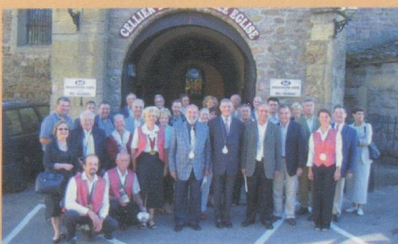
Cellier de la Vieille Eglise

La Chambre de Commerce Suisse en France, Région Rhône-Alpes Auvergne, a souhaité, dans le cadre de son développement, créer à Annecy une "Délégation Pays de Savoie" pour répondre aux attentes des chefs d'entreprises savoyardes qui bien naturellement entretiennent des relations fortes avec la Suisse Romande voisine comme dans la publicité, l'horlogerie, le transport, le décolletage ou le tourisme. Cette relation est également vraie pour