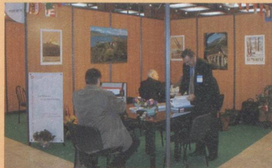
Salon Classe Export

des agents commerciaux français et suisses. Lors du Salon Classe Export au Palais des Congrès de Lyon, les 4 et 5 décembre 2002, la