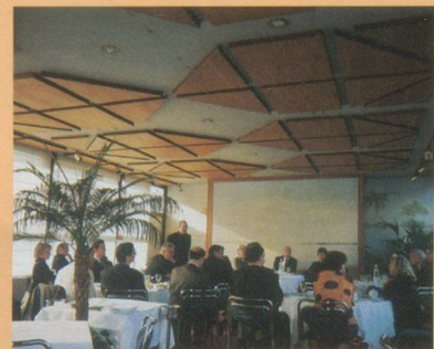
M. Chipman présente avec humour les diverses facettes de la Suisse alémanique

Dans la série des petits-déjeuners mensuels qu'elle organise sur