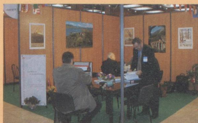
Salon Classe Export

des agents commerciaux français et suisses. Lors du Salon Classe Export au Palais des Congrès de Lyon, les 4 et 5 décembre 2002, la