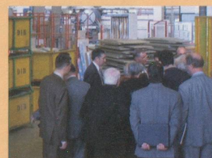
Ets Mobalpa

Lors du Salon de l'Automobile de Genève,