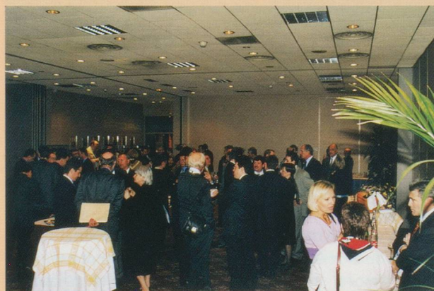
Vue du cocktail.