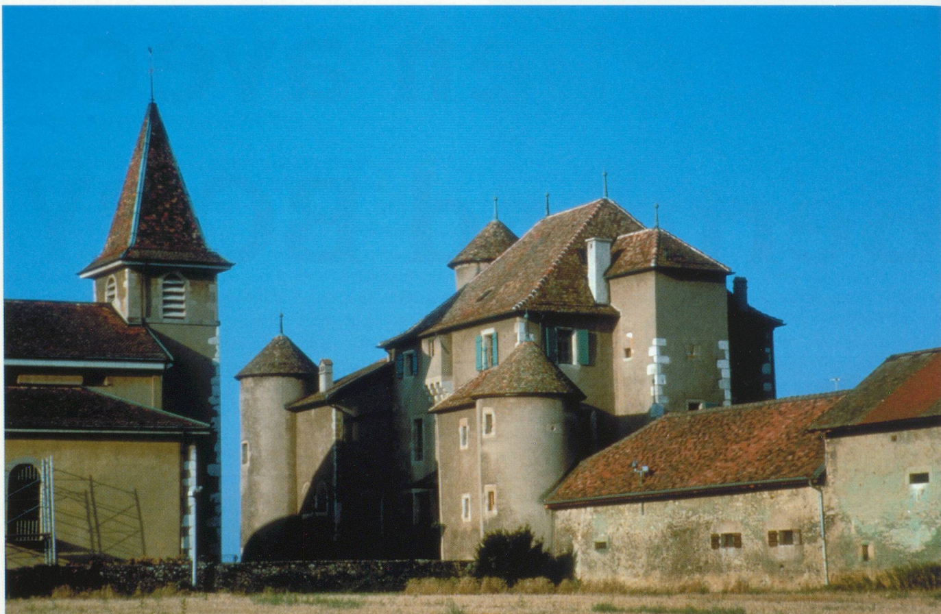
Château de Compesières

écrit par le professeur Yves Fassin, de l'Université de Genève. Détails les accords de Paris, en 2000, stipulant l'obligation d'échanges d'information entre les États membres de l'Union euro- péenne et des États tiers, telle la Suisse, concernant des comptes