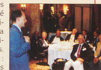
Bertrand Picard passionné nos adhérents...