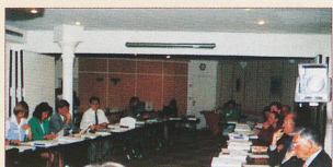
Plate-forme d'informations, elle met à la disposition de ses adhérents son savoir-faire pour trouver, à la bonne source, le renseignement recherché, défricher les questions difficiles, accompagner certaines démarches au plan local. Véritable « généraliste », elle s'appuie sur un réseau de spécialistes vers lesquels elle oriente les dossiers le nécessitant.