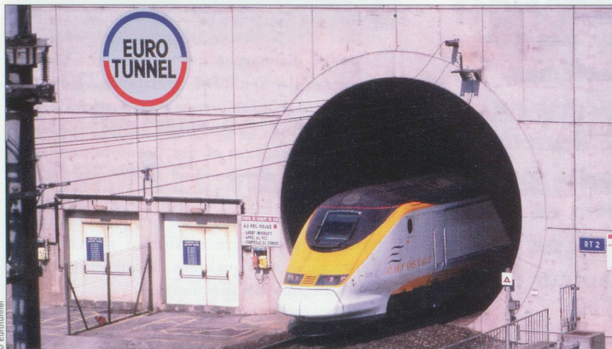
Portail côté France : un Eurostar arrivant d'Angleterre sort du tunnel.

tant à construire) et pour des raisons liées à la prise de conscience par les populations des enjeux qui s'attachent à la protection de l'environnement naturel, le débat s'est engagé sur la poursuite du développement du mode dominant. Le Gouvernement français travaille aujourd'hui sur la mise en œuvre d'une politique des transports dont l'objectif affiché est de réduire le déséquilibre entre les modes. Ainsi, dans le cadre de la loi d'aménagement et de développement durable du Territoire, les pouvoirs publics ont engagé l'élaboration des schémas de services collectifs dont deux concernent les transports (fret et voyageurs). L'innovation par rapport aux approches précédentes est d'ordre méthodologique : elle consiste à appréhender les problèmes de transports et de déplacements dans leur globalité, avec une vision multimodale voire intermodale. Les pou-