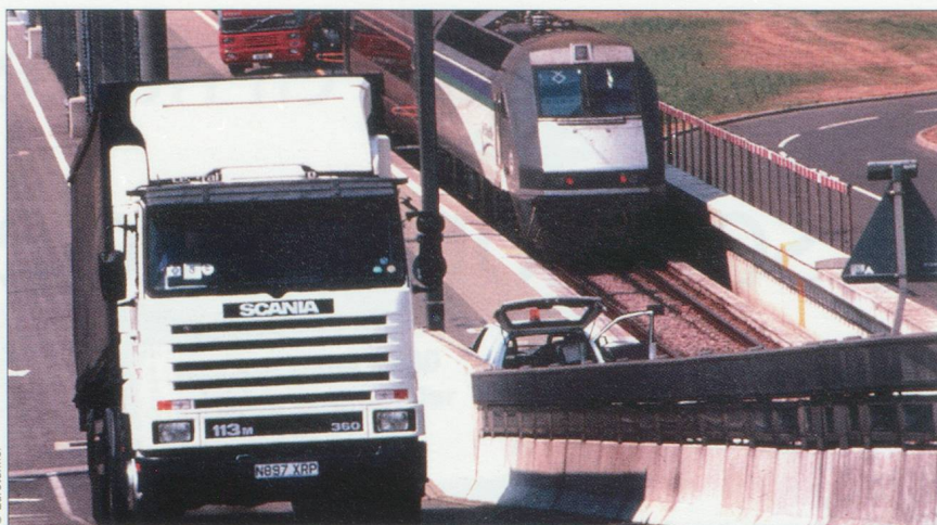
Débarquements de poids lourds.